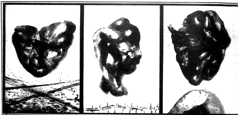
Memorias da guerra, 1918

—¿Que funcións cre que pode cumprir a arte, concretamente a pintura, no proceso educativo?