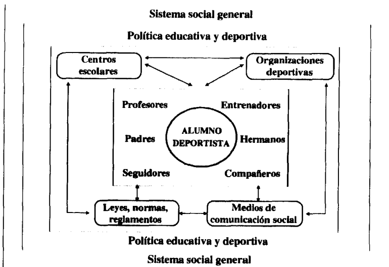
GRÁFICO III Modelo ecológico para la optimización del valor educativo del deporte (adaptado a partir de Gutiérrez, 1995, 2003)

Como vemos, en el centro del sistema encontramos al deportista, la persona. No cabe duda que es el propio sujeto quien debe tener una idea, una filosofía adecuada de lo que debe ser su práctica deportiva si quiere que ésta sea educativa, para lo cual habrá de seguir las condiciones y principios señalados en apartados anteriores.