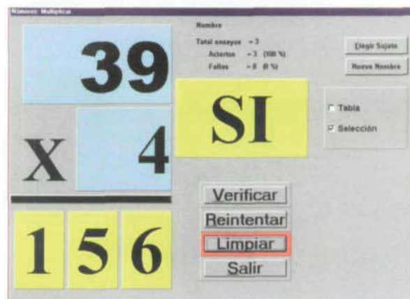
Figura 7. Multiplicación.

Se puede realizar cualquier operación de multiplicar con un solo dígito en el multiplicador y cifras de hasta tres dígitos en el multiplicando, cuyo resultado no exceda la cantidad de 999.