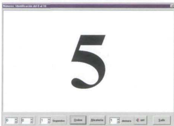
Figura 2. Identificación de formas numéricas.

Se realizan tareas de identificación, subdivididas en conjuntos numéricos de menor a mayor. En primer lugar se trabajan desde el 0 hasta el 10. Se presentan los números en orden, a un ritmo lento, y con acompañamiento de voz en «off» al cabo de una pequeña demora. A medida que el niño va dominando el nivel inicial, el profesor le cambia las condiciones de orden, pasando a «orden aleatorio». Si el niño identifica correctamente las formas, superará con facilidad la complicación de la presentación aleatoria de los números. En el siguiente paso, el profesor le quita la voz en «off», teniendo que identificar el número correctamente tanto en orden como en desorden sin soporte auditivo externo. Finalmente, los números se presentan a un ritmo más dinámico, con lo cual se comprobará la automatización de su reconocimiento formal.