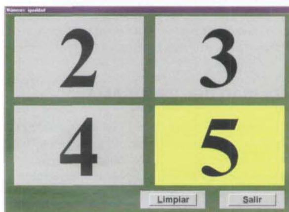
Figura 3. Relación entre números.

Como los números van apareciendo aleatoriamente, el niño está obligado a reconocer la forma que se le solicita, o a reconocer la igualdad entre dos formas, etc.