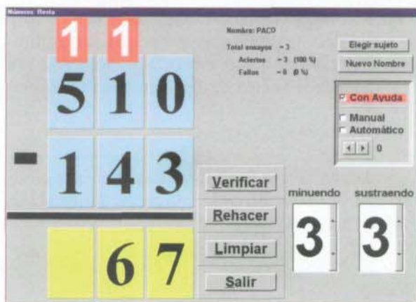
Figura 6. Resta.

Se puede realizar cualquier combinación de restas con cifras de uno hasta tres dígitos.