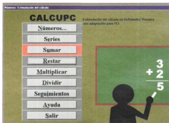
Figura 1. Programa CALCUPC: Menú principal.