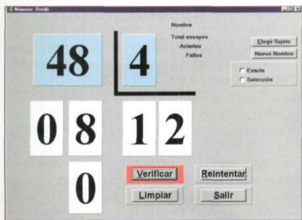
Figura 8. División.

Se puede realizar cualquier operación con una o dos cifras en el dividendo y una en el divisor.