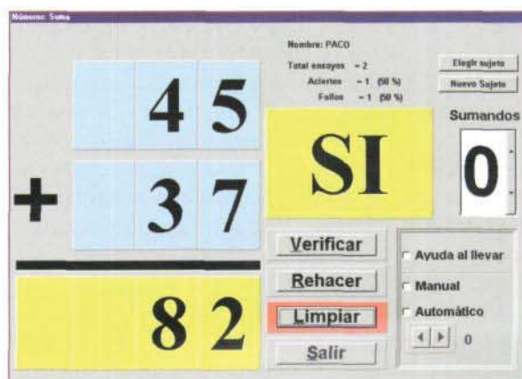
Figura 5. Suma.

Se puede realizar cualquier combinación de sumas con dos sumandos con cifras de uno a tres dígitos.