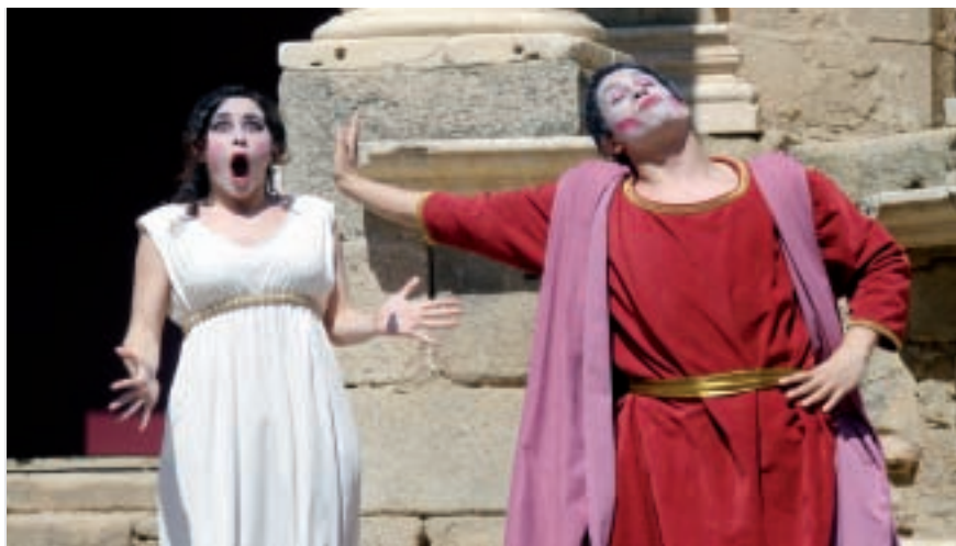
Aulularia, Mérida 2009.

mos más que agradecer a todos su participación en nuestra humilde historia. Y como es imposible citar a todos y todas en estas líneas queremos decir que sin su esfuerzo e ilusión hoy no estaríamos aquí.