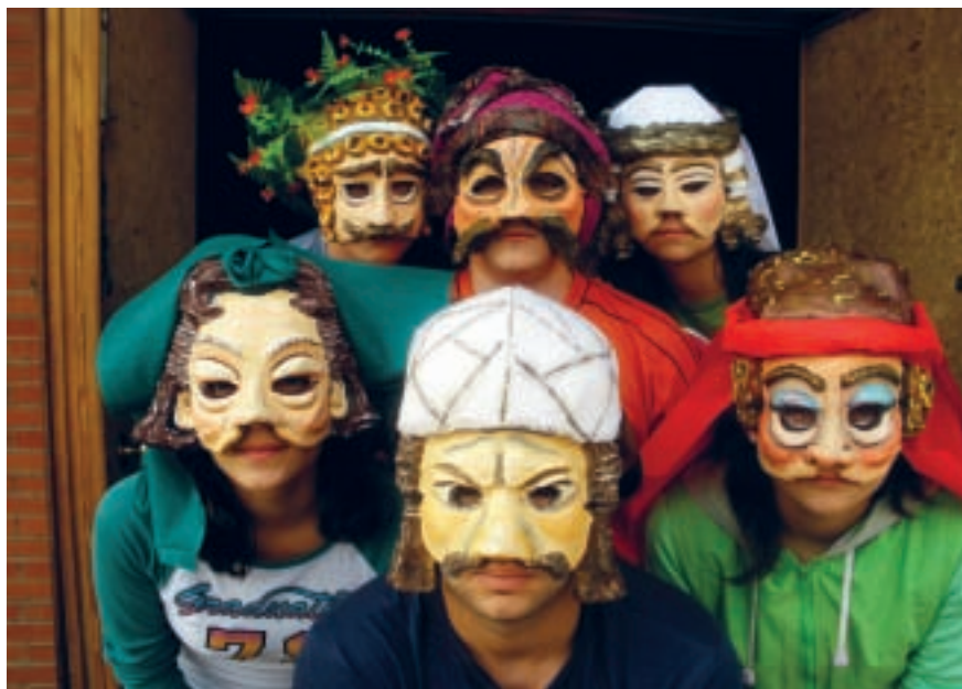
El gorgojo 2008. Teatro Romano de Segóbriga