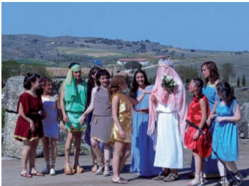
El novi@ va a desposarse con el granjero Olimpión