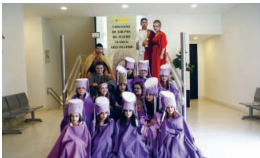
Electra 2010. Tarancón