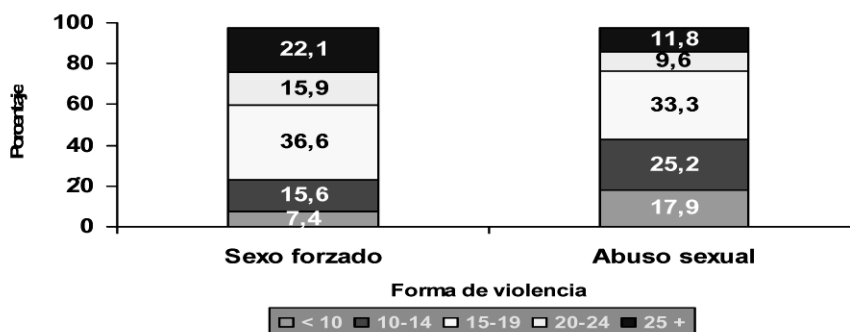
Edad al primer incidente de violencia sexual, según forma de violencia (Mujeres que reportaron sexo forzado o abuso sexual) Encuesta Demográfica y de Salud Materna e Infantil ENDEMAIN – 2004 Violencia contra la mujer