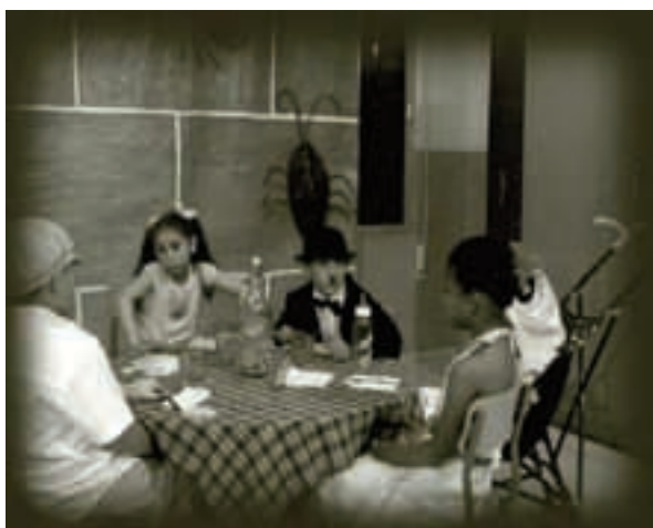
Fig. 6. El restaurant de la gent

Totes aquestes activitats s'han dut a terme durant més de tres mesos.