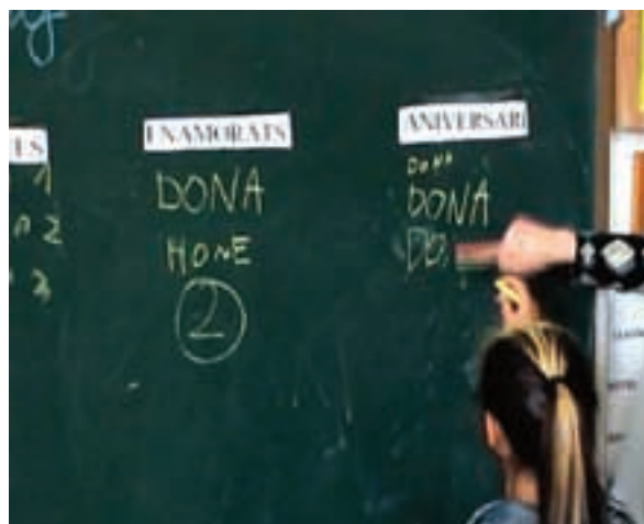
Fig. 3. Estudiant les accions