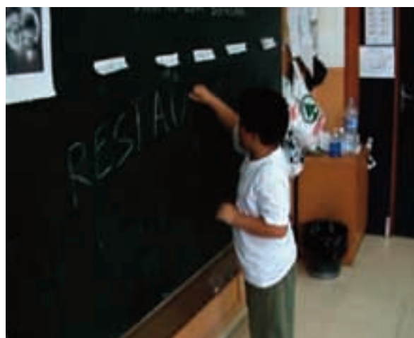
Fig. 5. Pensant el títol