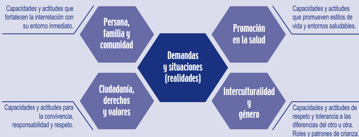
Gráfico de los contenidos transversales

Los contenidos transversales –por su importancia, trascendencia e influencia en el desarrollo de la vida de los adultos– son tratados desde las diversas áreas del currículo: Comunicación, Lógico-matemática, Desarrollo humano, y Proyección y análisis social y Formación para el desempeño ocupacional; es decir, los contenidos a través de estas áreas se concretizan y recrean adecuándose a la realidad local. En ese sentido, se proponen actividades conducentes a analizar diversas temáticas y a obtener reflexiones y conclusiones conjuntas que conduzcan a los participantes a actuar de manera responsable y crítica sobre su entorno familiar, comunal y social.