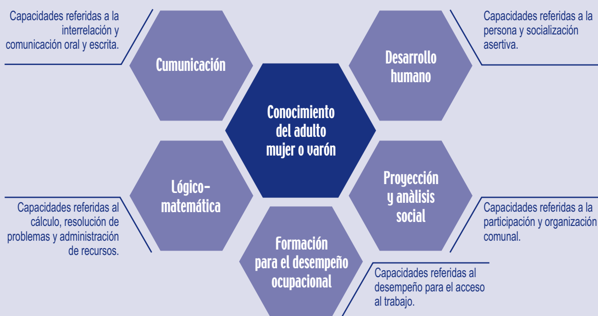
Gráfico de las áreas curriculares

Desde nuestra experiencia, la organización por campos de conocimiento, por un lado, brinda una educación integral y no fragmentada sobre la realidad; por otro lado, permite organizar las áreas por proximidad y centrar una temática de investigación.