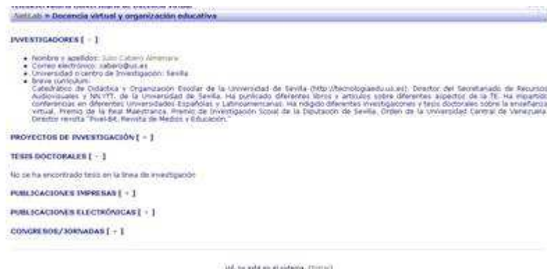
Fig. nº 4. Imagen proyecto NetLab (b).

por los miembros del grupo de investigación, y evaluación/calificación por los usuarios del teleobservatorio (fig. nº 4).