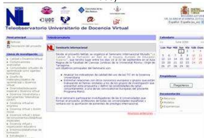
Fig. nº 3. Imagen proyecto NetLab (a).

Universidades españolas: Lleida (UdL), Girona (UdG), País Vasco (UPV), Islas Baleares (UIB), Rovira i Virgili (URV), Sevilla (US), A Coruña (UdC) y la Oberta de Cataluña (UOC) ( http://netlab.urv.net/ ) (fig. nº 3) (Gisbert, 2005).