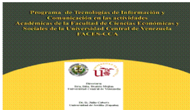
Fig. nº 12. Acción formativa conjunta entre el Grupo de Tecnología Educativa de la Universidad de Sevilla y la Universidad Central de

El material ha servido para desarrollar diferentes acciones formativas, no sólo en España, sino en otros países como Santo Domingo. Por ejemplo, se realizó una colaboración como Grupo de investigación de Tecnología Educativa de la Universidad de Sevilla con la Universidad Central de Venezuela, donde desde nuestra universidad se aportó los materiales digitales de formación, y por otro lado, se complementaron con unas secciones introductorias a través de videoconferencia. El resto de contenidos, apoyándonos en nuestro material, fue impulsado por profesores venezolanos. (fig. nº 12).