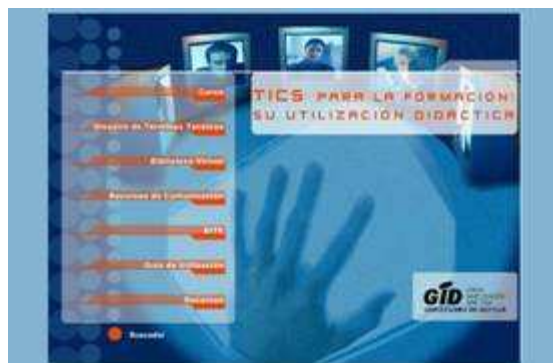
Fig. nº 10. Imagen portal curso “TICs para la formación: su utilización didáctica”.

En el terreno de la Tecnología Educativa, uno de los materiales elaborados ha sido el destinado a la formación del profesorado, fundamentalmente de secundaria, que respondía concretamente al nombre de “TICs para al formación: su utilización didáctica”. En su construcción, participaron profesores de distintas universidades: Sevilla, Huelva, Málaga, Murcia, Tarragona, País Vasco, y Barcelona (fig. nº 10).