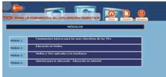
Fig. nº 11. Bloques de contenido curso “TICs para la formación: su utilización didáctica”.

En el primero se desarrollaban temas como: “Criterios generales para el diseño, la producción y la utilización de las TICs en la enseñanza”, “Bases generales para la evaluación de materiales para la enseñanza”, o la “Formación del profesorado en las TICs – las TICs para la formación del profesorado”. En el segundo, se presentaban algunos como: “La educación en medios de comunicación”, “Aproximación a los mass media”, o “Bases para la lectura de imagen”. En el tercero, que es el más amplio, se presentan entre otros los siguientes: “Utilización didáctica de las presentaciones colectivas informatizadas”, “El vídeo en la enseñanza”, “Los multimedia en la educación”, o “La incorporación de la informática a la enseñanza”. El último, que analiza específicamente la utilización de Internet, incorpora contenidos como los siguientes: “Internet en la educación”, “Internet como fuente de formación y de información”, “Diseño de materiales formativos para la red”, o “Estrategias didácticas para la red”.