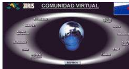
Fig. nº 8. Imagen portal "Comunidad virtual de Edutec en ResIris."

Pero de todas las acciones que lleva a cabo, posiblemente lo más importante de Edutec sea la comunidad virtual que ha formado, utilizando la Red Iris de las Universidades Españolas, donde se conforma desde una lista de distribución (fig. nº 8).