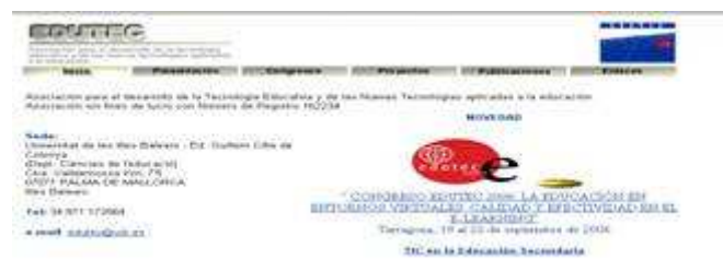
Fig. nº 5. Imagen portal Edutec (a).

Edutec es una “Asociación para el desarrollo de la Tecnología Educativa y de las Nuevas Tecnologías Aplicadas a la Educación”. Asociación sin ánimo de lucro, con número de registro 162234 de España. Se fundó en 1993 y su dirección web es: http://www.edutec.es/ (fig. nº 5).