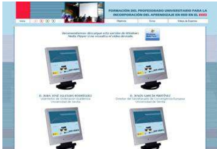
Fig. nº 2. Clips de vídeos ofrecidos en el proyecto: “Formación del profesorado universitario para la incorporación del aprendizaje en red en el EEES”.

La producción técnica de los materiales se realizó posteriormente en la Universidad de Sevilla, y su evaluación fue efectuada por los miembros del grupo de investigación, mediante una doble vía: