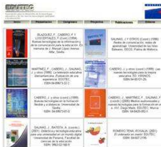
Fig. nº 6. Imagen portal EduTEC (c).

EduTEC ha llevado a cabo diferentes publicaciones impresas que poseen también su versión digital, realizadas entre los diferentes miembros que la configuran (fig. nº 6).