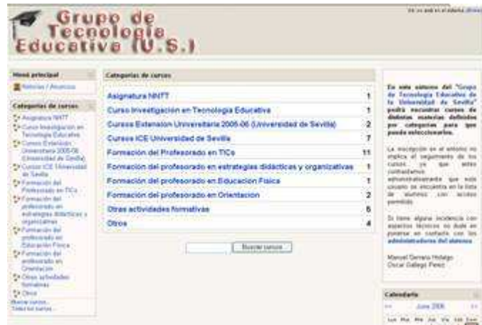
Fig. nº 9. Imagen plataforma Moodle de Grupo de Tecnología Educativa de la Universidad de Sevilla.

En el terreno de la Tecnología Educativa, uno de los materiales elaborados ha sido el destinado a la formación del profesorado, fundamentalmente de secundaria, que respondía concretamente al nombre de “TICs para al formación: su utilización didáctica”. En su construcción, participaron profesores de distintas universidades: Sevilla, Huelva, Málaga, Murcia, Tarragona, País Vasco, y Barcelona (fig. nº 10).