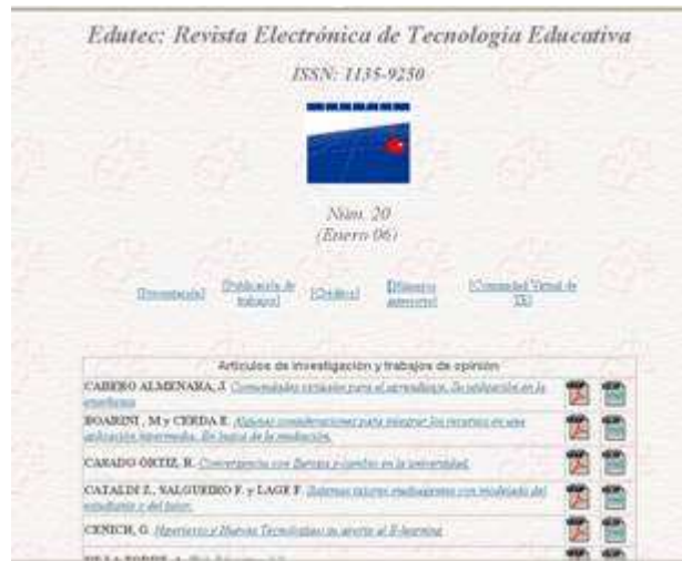
Fig. nº 7. Revista virtual de Edutec.

Pero de todas las acciones que lleva a cabo, posiblemente lo más importante de Edutec sea la comunidad virtual que ha formado, utilizando la Red Iris de las Universidades Españolas, donde se conforma desde una lista de distribución (fig. nº 8).