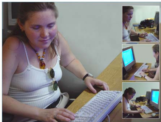
Figura 1. Una aprendiz ciega interactuando con APL a través de sonido.

¿Cuáles son las necesidades específicas de los aprendices ciegos para programar?, ¿por qué es complejo para ellos entender los lenguajes de programación convencionales?, ¿podemos desarrollar un lenguaje de programación para que ensamble mejor con sus necesidades?. Estas son algunas de las preguntas que guiaron nuestro estudio.