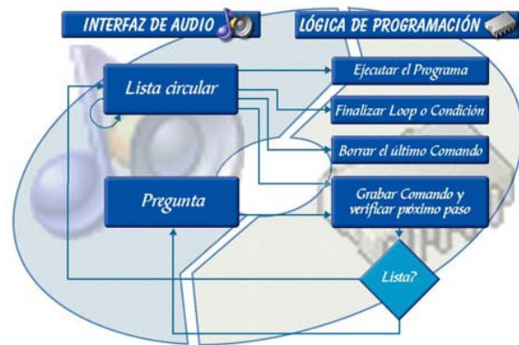
Figura 2. Capas de APL

Nuestro objetivo fue desarrollar una aplicación que facilite la manipulación de un lenguaje de programación para aprendices ciegos. Para ello, proporcionamos elementos facilitadores que orienten a los programadores ciegos novatos, mediante la disminución de la complejidad de la sintaxis de un lenguaje convencional y la incorporación de funciones para analizar los programas finales.