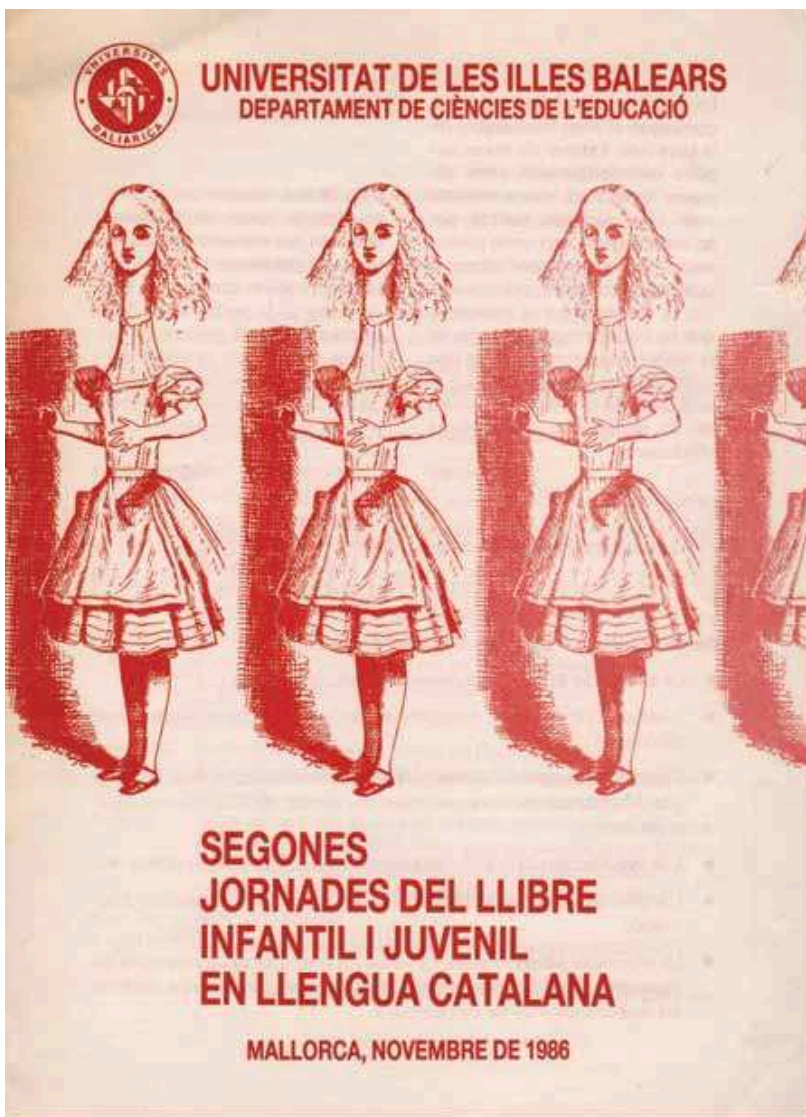
Díptic publicat per la Universitat de les Illes Balears en el 1986.

BASSA, Ramon (1984). «El llibre infantil com a element d'intervenció sòcio-educativa». 60 Luc , 718 (November-December 1984), pages