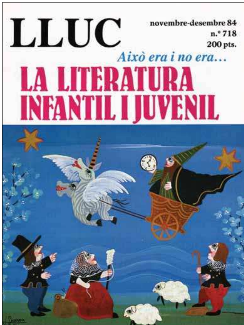
Un Dels Números de la revista Lluc a l'any de 1984.

bibliotecaris, a pares, a polítics, als mitjans de comunicació social, etc.; una crida per a la defensa del llibre infantil i juvenil en totes les seves dimensions, nivells i perspectives.» (F. Cubells 1985, 1.)