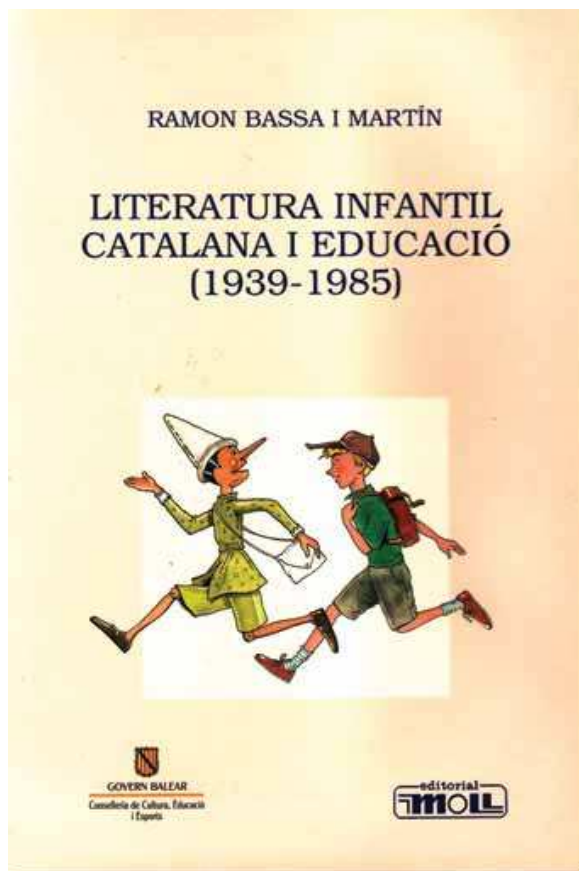
Portada del llibre de Ramon Bassa i Martín, Literatura infantil catalana i educació , Editorial Moll, 1994.