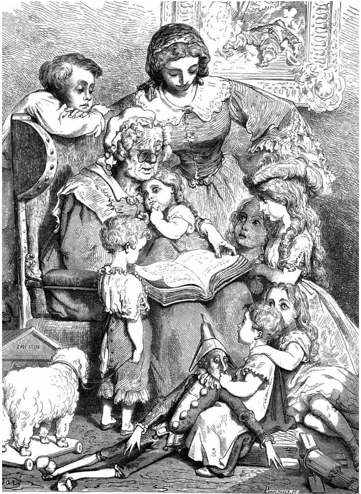
Il·lustració de Gustave Doré per a Pell d'ase dels Contes de ma mère l'Oye , de Charles Perrault.