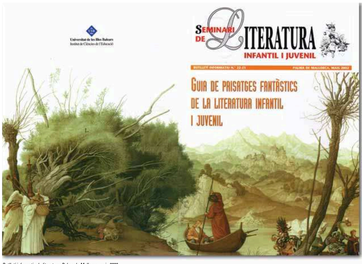
Butlletí informatiu de literatura, Palma de Mallorca, maig 2002.