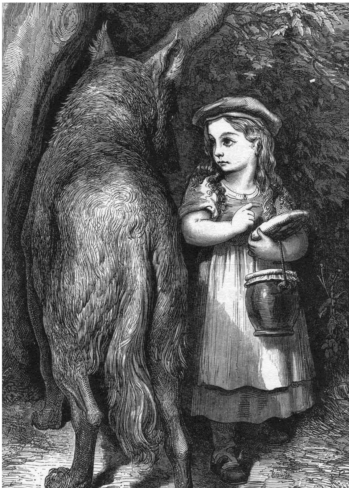
Il·lustració de Gustave Doré per a la Caputxeta Vermella dels Contes de ma mère l'Oye, de Charles Perrault.