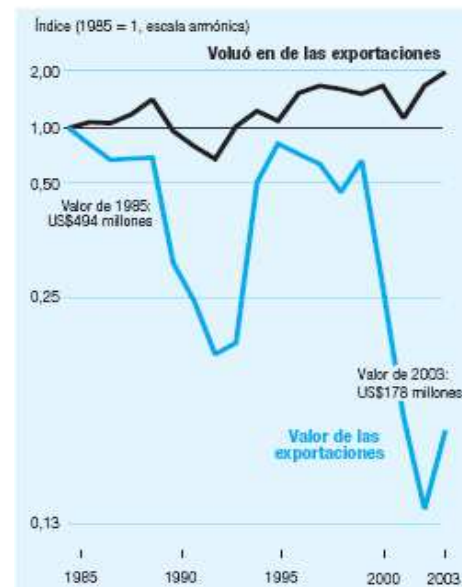
Gràfica 2. Caiguda dels preus del cafè a Etiòpia Font: Informe del Desenvolupament Humà 2005

Per altra banda, el sistema de comerç internacional actual es fonamenta en el que es coneix com a "intercanvi desigual". L'equació de l'intercanvi desigual és ben senzilla: els articles del Centre són cars i els de la Perifèria barats, la qual cosa genera un important dèficit comercial als països del Sud. Aquesta diferència de preus no recau tant en el tipus de productes com en les diferències salarials entre els països -tinguem en compte que els salaris són un dels components més importants del preu dels productes. De fet, els baixos salaris del Sud i el consegüent baix poder adquisitiu de la seva població és una de les principals raons que molts països del Sud -com dèiem en el paràgraf anterior- orientin la seva economia a l'exportació. S'entra així en un cercle viciós del qual és difícil sortir-ne.