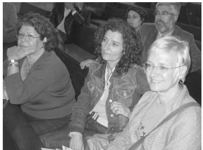
Presència de l'STEI-i al FSIPE.

Cita Derrida i Giddens, declarats no marxistes, que diuen que l'anàlisi de Marx no ha estat superat per ningú. Cita el capítol primer d' El Capital , el que parla de la força del treball, dels mitjans de producció, de la plusvàlua, del productor, del producte i del salari. Diu que sorgeix el capitalisme quan la força del treball es converteix en mercaderia i es venuda pel seu titular per obtenir mitjans de subsistència. Diu que és en la compra de la força del treball que s'amaga la transformació dels doblers en capital. També afirma, seguint Marx, que la propietat privada transforma els mitjans de producció en fins als quals queda subordinat l'home i que no és el treballador qui utilitza els mitjans de producció, sinó a l'inrevés. Amb tot això afirma que és la propietat privada la que aliena l'home en un procés impersonal de la seva transformació de fi en mitjà, de persona en instrument de la seva pròpia dominació. I aquest seria un bon principi, si tengués temps, per parlar del que pensaven Marx i Engels sobre la intervenció de l'Estat en l'educació, en un estat capitalista. Després parla de la possibilitat de comerciar sense mercaderies, els que presten un servei són reduïts a assalariats i es converteixen en un engranatge del procés de producció. És per