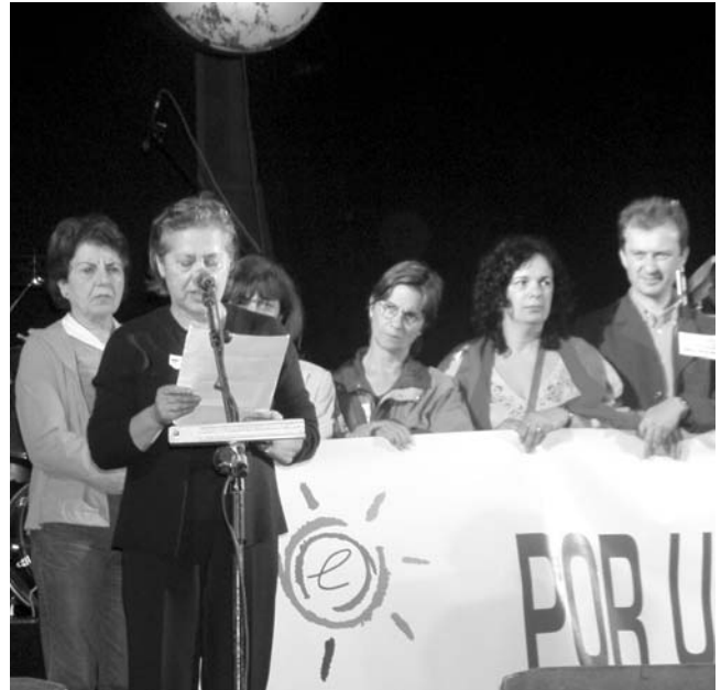
Parlament final a la manifestació per l'escola pública.

Diu que Wallerstein avisa que si els moviments antisistema no tenen clara la seva orientació ideològica, poca cosa podran fer contra el neoliberalisme. També parla del paper dels intel·lectuals i cita Bordieu: “Hem de