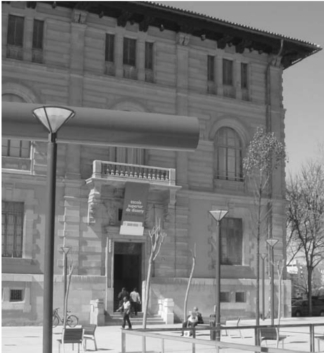
Façana de l'Escola Superior de Disseny

professional i percepció àmplia a l'estudiant perquè en el seu futur professional tingui les eines necessàries per adaptar-se a les necessitats i demandes socials.