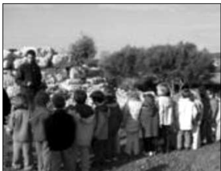
Observant els talaiots de Son Fornés

Després de totes aquestes experiències va arribar el moment de que cada un fes la seva aportació d'aquí varen sorgir tres possibles hipòtesis: