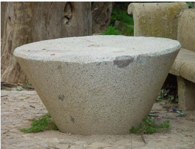
Piedra de molino