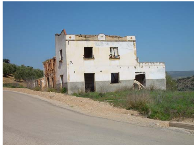
Venta del puente (Olvera)