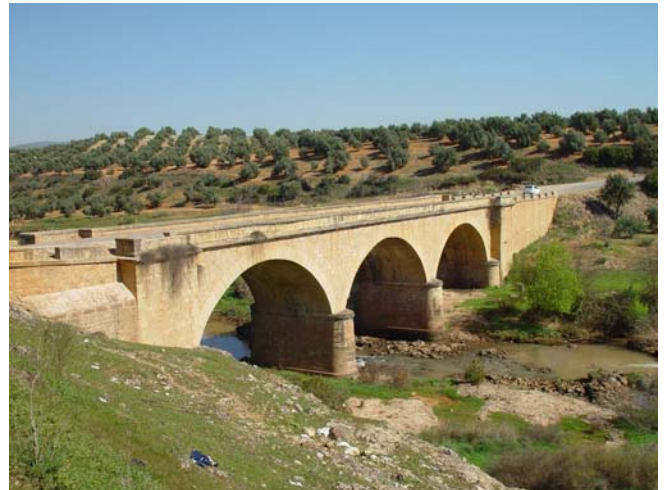
Puente de Olvera