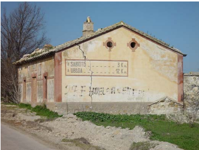
Casa de los peones camineros