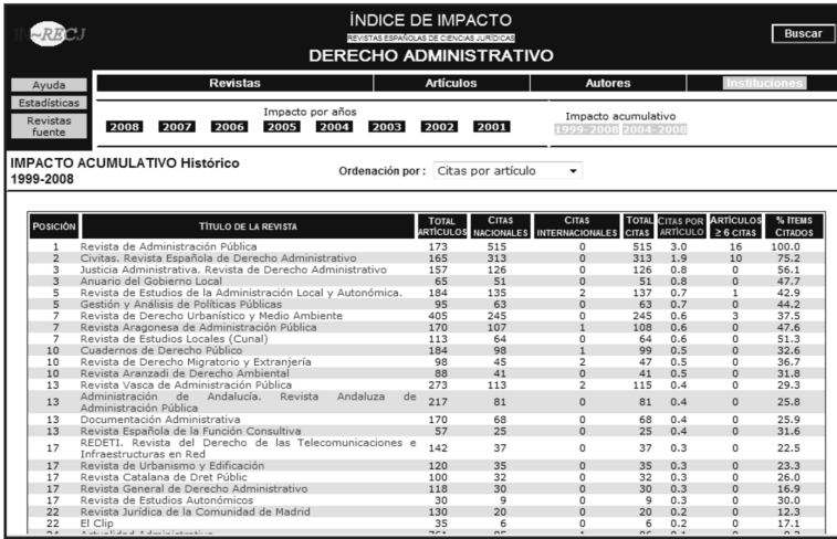
Figura 3. Índice de impacto acumulativo (1998-2008).

Asimismo los impactos anuales se acompañan de dos impactos acumulativos (Figura 3): uno que muestra el impacto del último quinquenio y otro que abarca desde el comienzo de la base de datos (2001 para jurídicas). Con estos acumulados podemos apreciar de forma más ajustada la repercusión de las revistas, ya que conocido el lento envejecimiento de la literatura científica de las ciencias jurídicas, al tomar periodos de tiempo más amplio se capta mucho mejor toda la potencialidad de citación de las revistas y se evitan las oscilaciones anuales a que se ven sometidas como consecuencia del reducido tamaño de los datos. A fin de mejorar la precisión de los rankings se ofrecen otros indicadores bibliométricos que califican muy bien la relevancia de una revista, como son: la ratio citas por artículo que fija el promedio de citas del artículo típico de cada revista, el porcentaje de artículos citados respecto del total de artículos publicados y el número de artículos altamente citados.