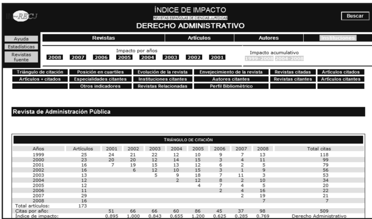
Figura 4. Datos de citación de una revista y evolución de su impacto.