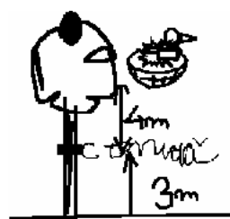
Diagrama de AN

aplica la raíz cuadrada de los cuadrados de los catetos con corrección y muestra que debe ser un triángulo rectángulo.