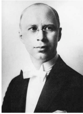
Sergei Prokofiev (1891-1953)

1891n jaio zen, Ukraniako herri txiki batean.