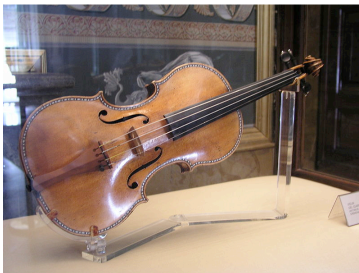
Madrilgo Errege Jauregiko bildumako Stradivarius biolina.

Arkua makila estua da, okerdura leun bat egiten duena. 77ren bat cm da luze, eta 70 cm-ko hari bat du, zaldi-isatseko 100-120 zurdez osatua. Hariak dardaratzeko eta era eraginkorrean hots egin dezaten, zaldi isatsezko zurdak aldian behin eta era egokian igurtzi behar dira erretxinaz. Maiz, kostua merkatze aldera, zuntz binilikoez ordezkutzen da zaldi-zurda.