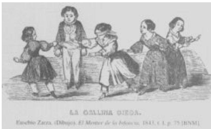
"Itsumandoka" (1845) Eusebio Zarzaren marrazkia. Madrilgo Liburutegi Nazionala.