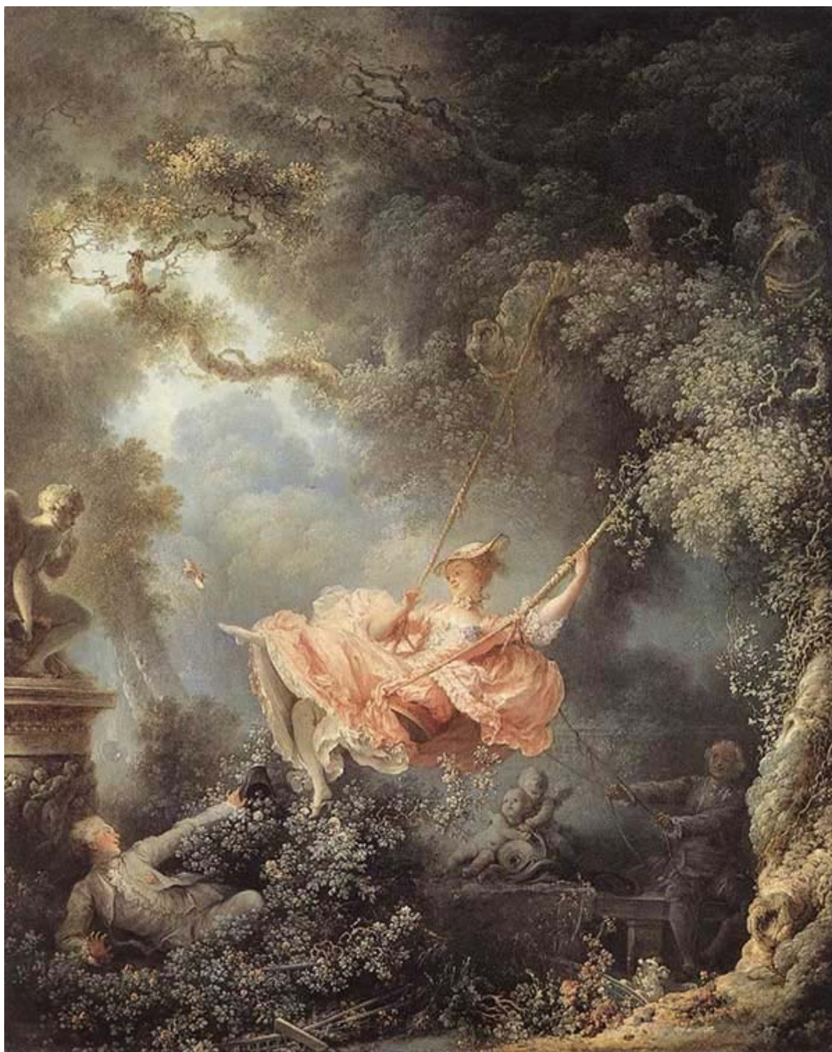
Zabua , Jean H. Fragonard (1732-1802)