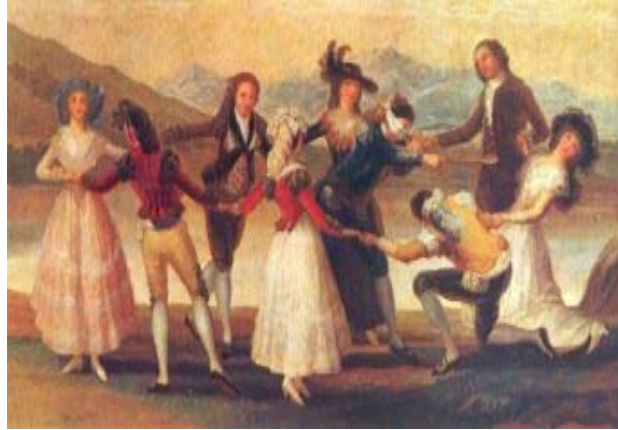
"Itsumandoka" edo "burruntzalia" Goya (1788) Museo del Prado (Madrid)