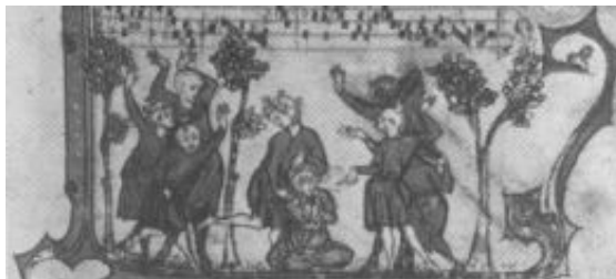
XIII. mendeko eskuizkribua. Montpelliengo Alger Museoa