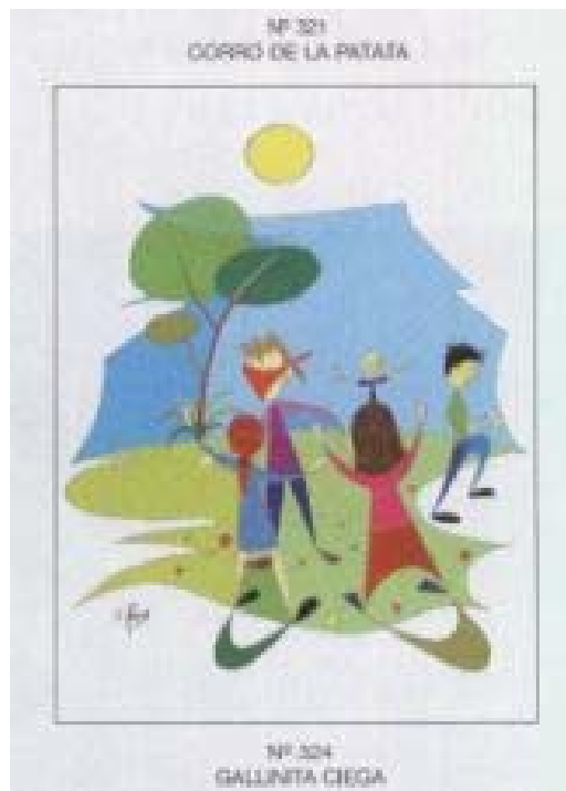
Bilduma pribatua. Ramos. (1998)