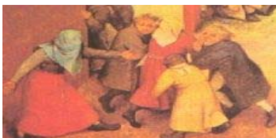
"Itsumandoka" jostaketa. Ume-jolasak Xehetasuna.