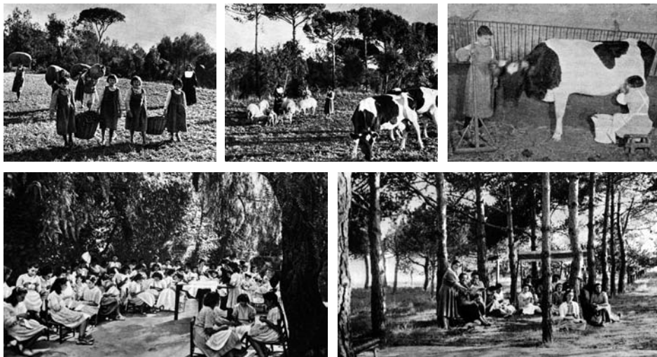
Imágenes diversas de las Granjas y Escuelas-Hogar femeninas.