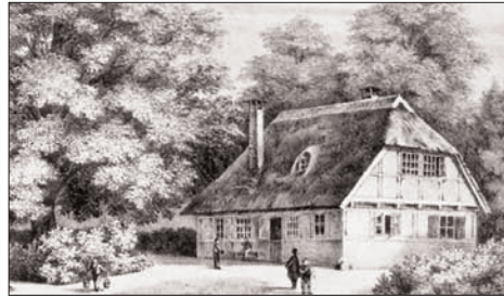
Rauhe Haus (1832). J. Wichern: Sämtliche Werke. Berlin & Hamburgo. Lutherisches Verlagshaus, 1962. 5 Vols.