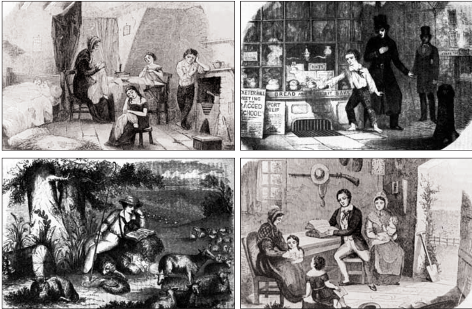
Las escenas (1, 2, 3 y 4) pertenecen a una serie de seis grabados incluidos en “The history of a ragged boy”, en Ragged School Union Magazine , 1850, Vol. II, págs. 89 y 300.

Los “estudios sociales” del diecinueve, en general, asumieron como teoría el modelo del “ambientalismo o ecología social”, y por lo tanto eran fundamentalmente intervencionistas. En este sentido, las “ciencias sociales” no eran campos de saber teóricos, sino saberes orientados directamente a la “reforma” social práctica. “Las ciencias sociales eran filantropía efectiva”, en las que el eje ciencia-reforma era la bisagra esencial para comprender el carácter de los estudios sociales y de su desarrollo posterior que han tenido como disciplinas. El modelo teórico ecológico justificaba la intervención de los reformadores, ya que era posible cambiar los comportamientos sociales por modificación de los factores ambientales. Y las respuestas se orientaron a “reformular los espacios” como clave para la “reforma moral o social” del sujeto, buscando con intervenciones legales, higiénicas, educativas y asistenciales hacer de los sujetos miembros útiles o “adaptados” a los patrones sociales. ¿Qué tipo de condiciones debían ser reformadas? Aquéllas relacionadas con los problemas del pauperismo, la criminalidad, la salud pública, el alcoholismo, la delincuencia y la “degeneración”. Cuestiones vistas como síntomas de un síndro-