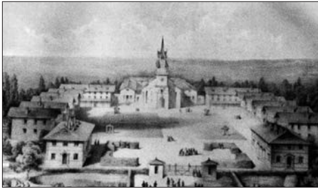
Mettray. (1839) Album del Archivo de CRIV. Ministère de la Justice. Vauresson (París).

nivel privado como estatal (Juderías, 1908; Carlier, 1994), convirtiéndose casi en el modelo oficial tras la ley de 1850. En Inglaterra, la influencia de la colonia gala se dejó sentir vivamente. Filántropos y reformadores sociales de la época victoriana fueron visitantes de Mettray y vehementes propagandistas del nuevo modelo (Drive, 1990). El empuje del movimiento se hizo notar rápidamente: de 61 reformatorios oficialmente aprobados de 1854 a 1875, 46 estaban localizados en zonas rurales y los jóvenes empleados en labores agrícolas (Stack, 1979). Las influencias llegarían a Holanda, que tuvo también una Nederlandsch Mettray (1852) (Dekker, 1990 y 1994), y reverterían de nuevo en Suiza, reafirmando a las pioneras tendencias autóctonas, y también en Bélgica, donde las cinco escuelas de reforma masculinas existentes pasaron a ser en 1880 “escuelas agrícolas”, para volverse a transformar en 1896 en establecimientos mixtos (agrícolas e industriales), a excepción de la de Gante, que era exclusivamente industrial (Juderías, 1908, 124-145 y 548-561; Dupont-Bouchat, 1995). Y el movimiento alcanzaría también el otro lado del Atlántico extendiéndose con renovado vigor en Estados Unidos (Platt, 1982, 84-96).