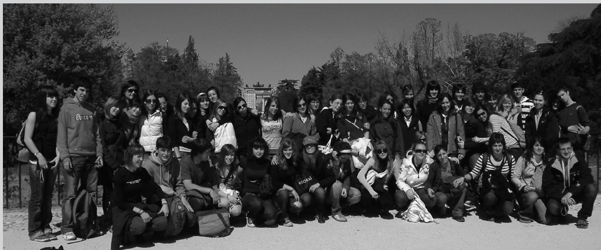
Alumnos y alumnas del IES Toki Ona BHI en Milán