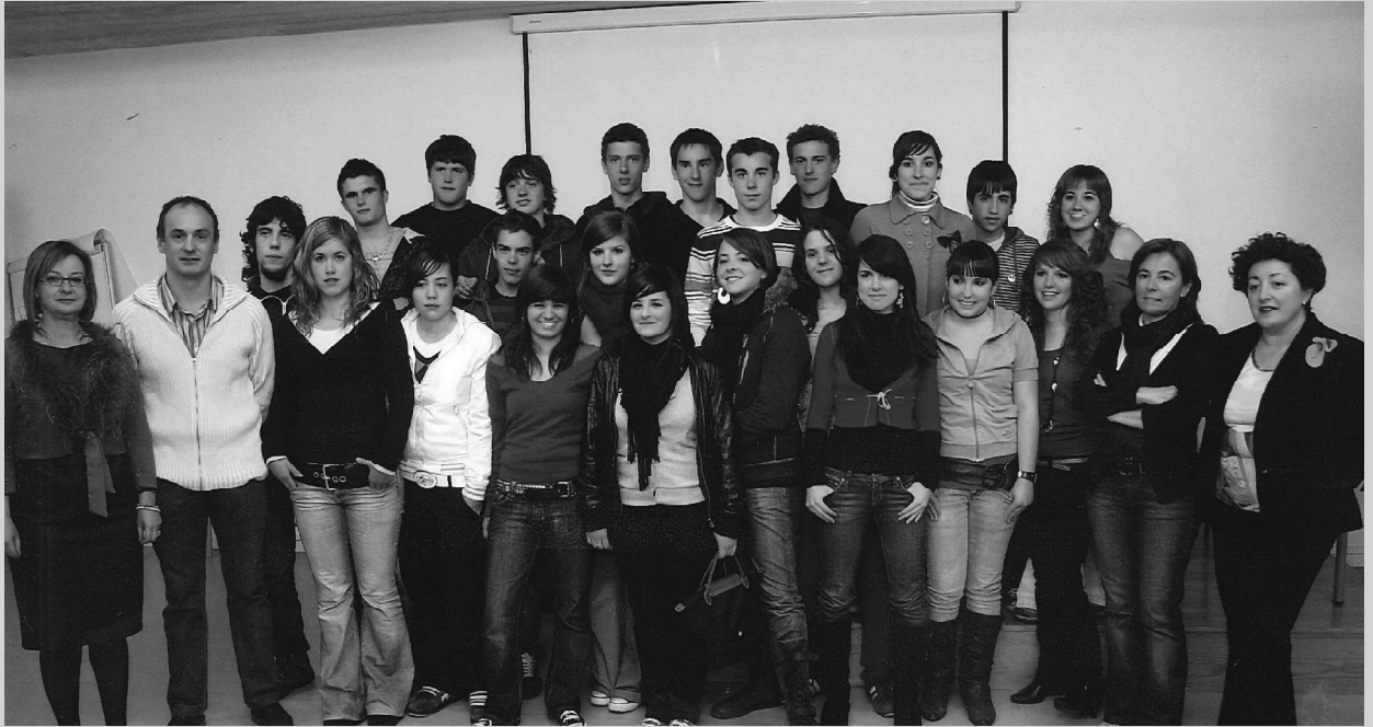
Los estudiantes de Zizur y de Cantau que han participado en el intercambio este año, junto con sus profesores

El Departamento de francés está muy satisfecho con este programa de inmersión lingüística ya que ha supuesto una primera toma de contacto con hablantes francófonos para la mayoría de los alumnos, y la mejoría que han experimentado tanto en la comprensión oral como en la expresión ha sido muy notable.