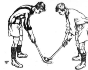
Fig. 1.—Golpe de salida (bully)