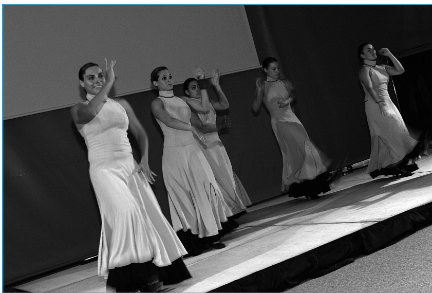
El taller que s'emportà el rècord de propostes fou el d'Educació física integral. S'hi combinaren intervencions teòriques, pòsters i pràctiques tals com dansa o "Stretch-Pilates" entre d'altres.

A partir d'aquest moment només calia esperar conèixer les diferents persones i experiències el dia del Diàleg, tot restant a la seva disposició per qualsevol dubte que tinguessin.