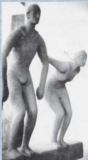
▶ Figura 8 Nedadors (1935-1936).