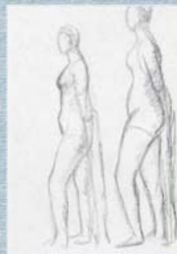
Figura 11 Banyistes (1934). Esbossos, llapis s/paper.