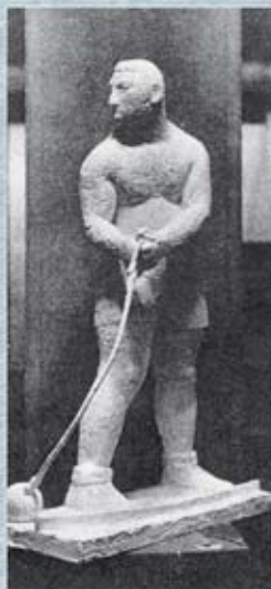
▲ Figura 6 Llançador de martell (1931).