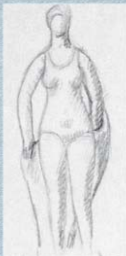
▲ Figura 10 Banyista (1934-1935). Esbós llapis s/paper.