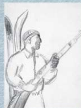
▲ Figura 12 Milicià Batalló Alpí (1930). Esbós, llapis i tinta s/cartolina.