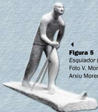
◀ Figura 5 Esquiador (1931).