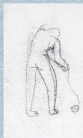
▲ Figura 9 Llançador de martell (1930). Esbós, llapis carbó s/cartolina.