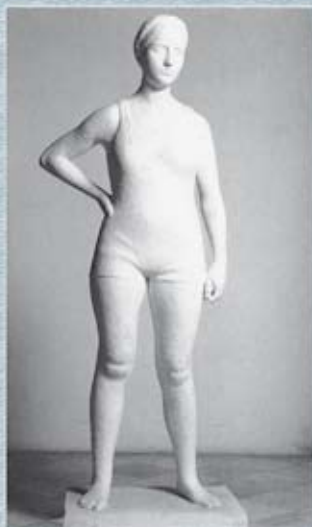
◀ Figura 7 Banyista (1935). MNAC. Barcelona.