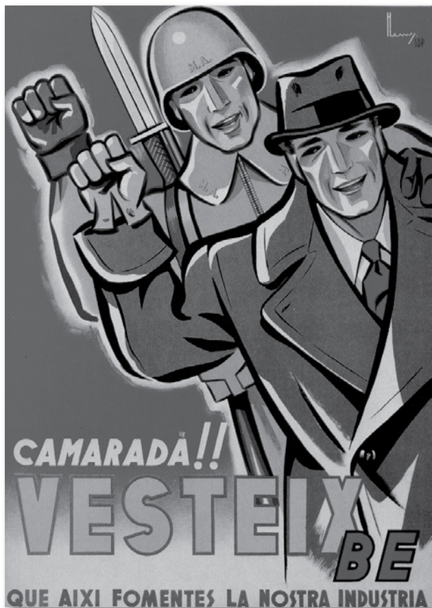
Cartell Henry, 53 x 38 cm (1937)

nia clara i neta i de coloració viva i agradable. Els dos primers, que són de 1937, possiblement recordant el seu arrelat ofici de dissenyador de moda, tenen unes característiques que trobem que són ingènues, inaudites i absurdes. En l'un, hi figura en primer terme, per davant d'un soldat impecable, un home elegant, amb barret, abric, camisa, corbata i guants; en l'altre, una dona que duu un barret amb dues plomes, un vestit de tipus sastre, brusa i corbata, situada davant d'una perfecta infermera. En tots dos casos el mateix lema inversemblant: "CAMARADA! VESTEIX BÉ, QUE AIXÍ FOMENTES LA NOSTRA INDÚS-