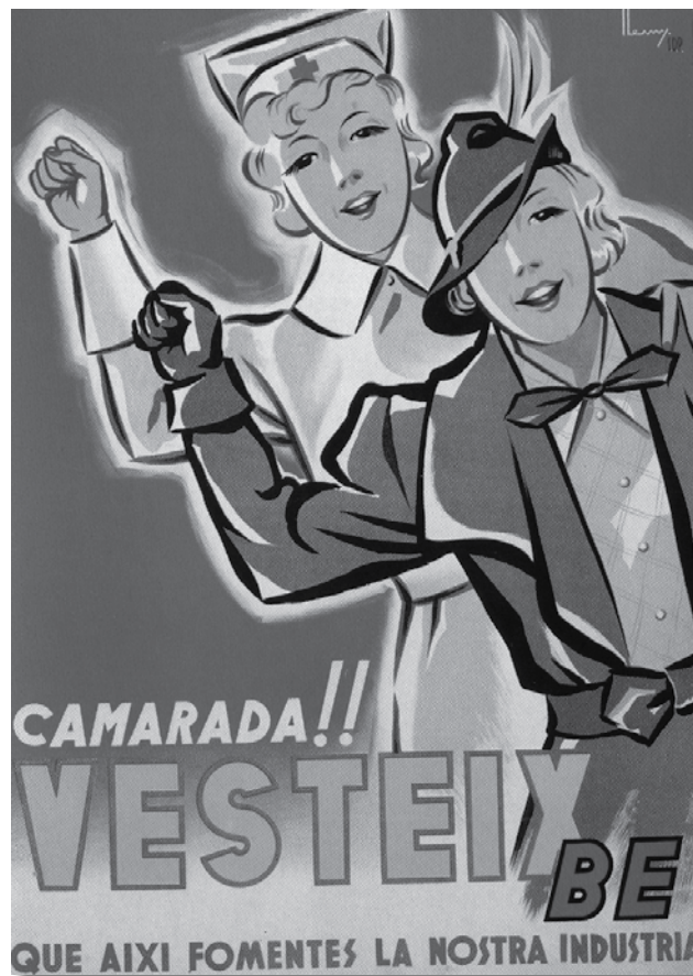
Cartell Henry, 53 x 38 cm (1937)