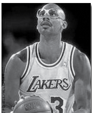
Kareem Abdul Jabbar