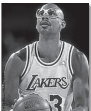
Kareem Abdul Jabbar