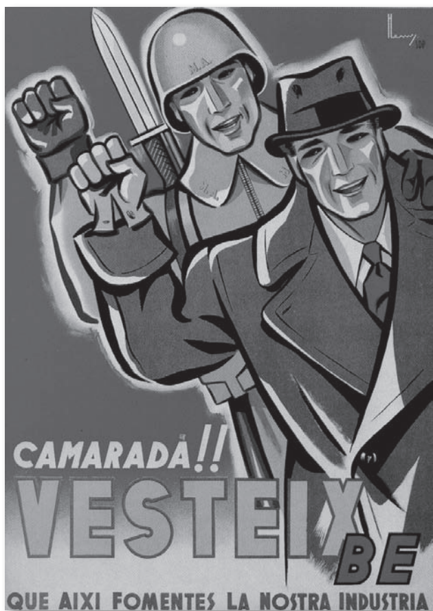
Cartel Henry, 53 x 38 cm (1937)

de coloración viva y agradable. Los dos primeros, que son de 1937, posiblemente recordando su arraigado oficio de diseñador de moda, tienen unas características que pensamos que son ingenuas, inauditas y absurdas. En uno de ellos figura en primer término, por delante de un impecable soldado, un hombre elegante, con sombrero, abrigo, camisa, corbata y guantes; en el otro, una mujer que lleva un sombrero con dos plumas, un vestido tipo sastre, blusa y corbata, situada delante de una perfecta enfermera. En ambos casos el mismo lema inverosímil: “¡CAMARADA! VISTE BIEN, QUE ASÍ FOMENTAS NUESTRA INDUSTRIA”. Concretamen-