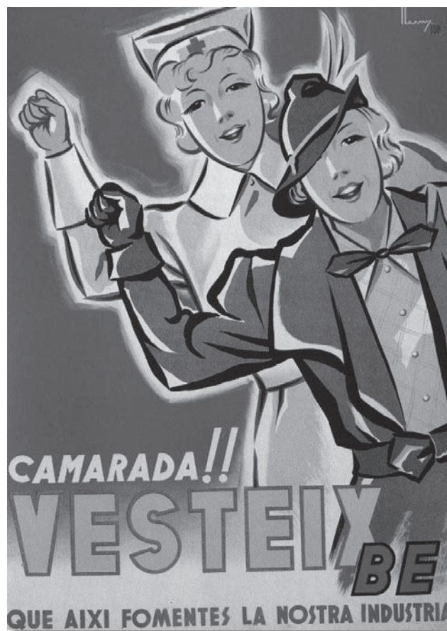
Cartel Henry, 53 x 38 cm (1937)