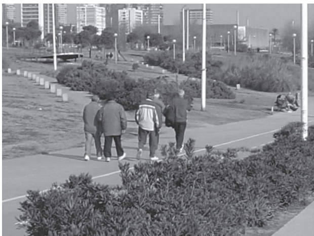
Caminadors del Passeig Marítim que es troben en la Barceloneta per anar junts és un exemple de relació sense compromís formal que perdura al llarg del temps.