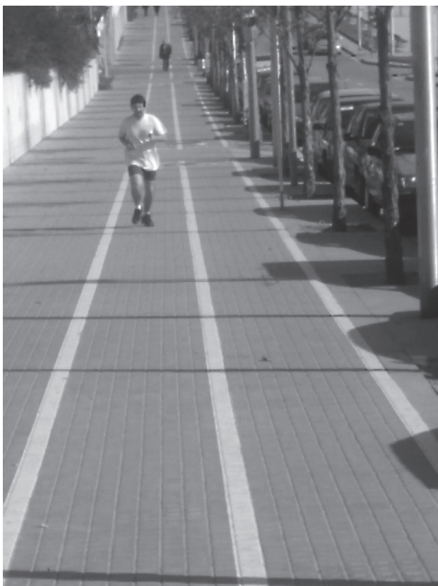
Corredor. La realitat dels espais delimitats per a un determinat tipus de pràctica, no sempre es correspon amb el seu plantejament teòric. Exemple: carril bici de la Ronda Litoral.

entrevistes es desprèn que es reconeixen de caminar per la zona i que mantenen xerrades i fins i tot caminen junts si es troben i els ve de gust, però que han intimat amb pocs o cap d'ells. Contràriament, a la mateixa zona també trobem un altre grup similar –coneguts entre ells de caminar per la mateixa zona– que ens va informar que tenien un dia i un lloc de trobada predeterminat, malgrat que no havien formalitzat mai aquesta relació i no se sentien obligats a mantenir-la: el costum s'ha fet norma.