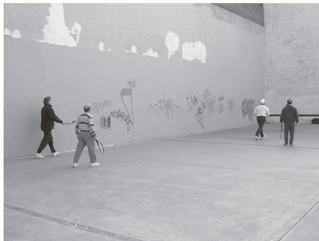
El frontón del Parc del Clot fue diseñado como un cine al aire libre. Los mismos usuarios fueron convirtiéndolo en un frontón.

“Son muy variados. De todos los barrios, hay gente que a lo mejor viene de Badalona, de Santa Coloma, otros son de aquí de Sant Andreu, otros son del Guinardó, yo soy de Sant Andreu, tocando el Guinardó [...]. Luego hay algunos que son de aquí claro, son del barrio. Pero donde yo también juego hay gente del barrio, la mayoría, si vamos 10 son unos 5 del barrio, seguro, pero los otros, uno viene de Mataró, otro de Santa Coloma, otro viene de la Villa Olímpica, otro de más allá de Hospitalet” (usuario del Parc del Clot).