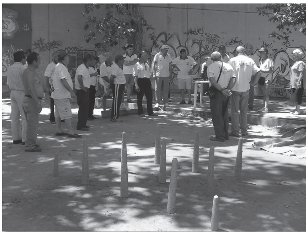
Los aficionados a los bolos leoneses del Carmelo consiguieron un espacio adecuado para sus encuentros y prácticas en 1996, una vez constituido el “Club de Bolos Leoneses d’Horta”; después de una larga experiencia de informalidad que iniciaron en los años setenta.

No obstante, tampoco se trata de la única función sino que también tiene que ver con maneras de mantener antiguas amistades, ocupar el tiempo con actividades de ocio, diversión, pasar el rato, etc.