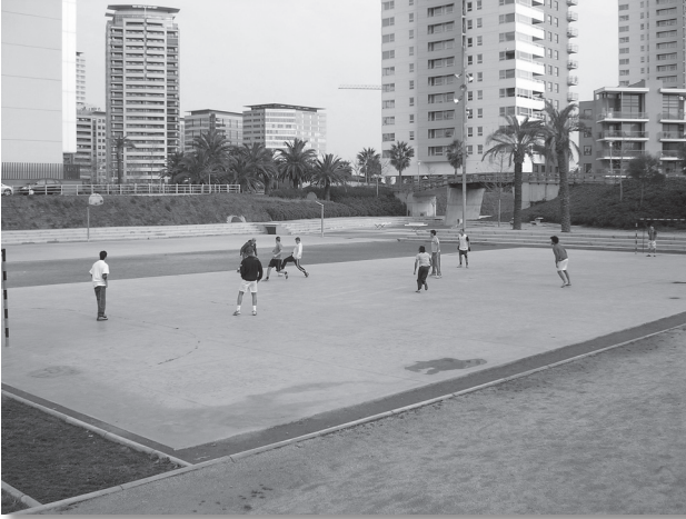
En el Parc Diagonal-Mar distintos grupos de amigos adultos se encuentran para realizar partidos de fútbol. Se queda siempre el equipo que gana a dos goles.