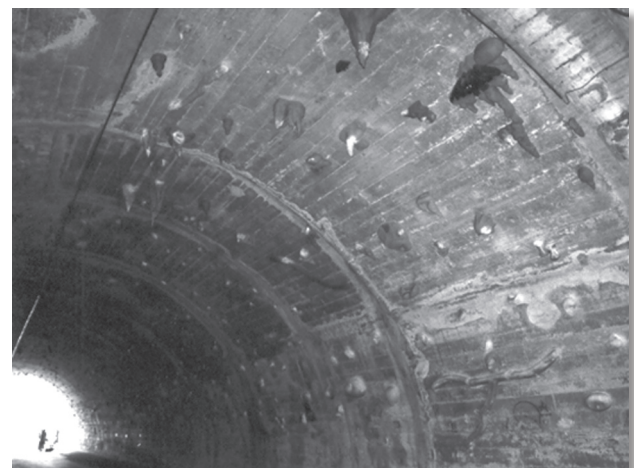
El túnel del Camí de la Foixarda ha sido transformado en un rocódromo de libre acceso a partir de la iniciativa de algunos usuarios que han invertido dinero y horas de trabajo desinteresadamente.

Otras redes importantes a tener en cuenta dentro de esta categoría son las de skateboarding , explicada en este mismo dossier monográfico (Puig y Maza, 2008) por