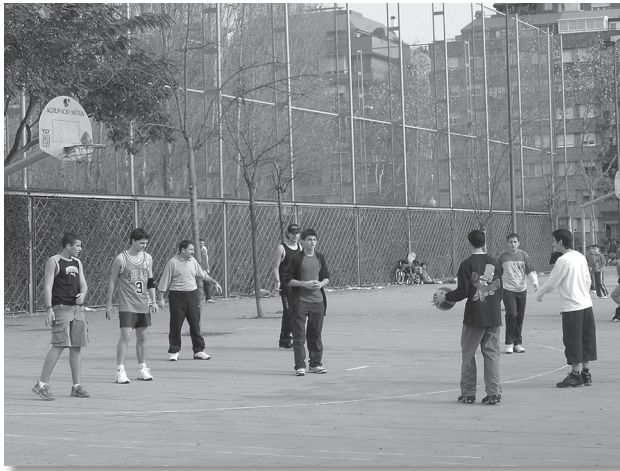
Un grupo de amigos adolescentes se encuentra cerca de sus casas, en el Parc de Can Dragó, para practicar baloncesto durante su tiempo libre.

“Solemos ir a barandillas, posa manos [...] Por ejemplo, en Sant Cugat hay una, en Cerdanyola, en Castellar del Vallés [...] sitios donde podemos patinar. O aquí en Barcelona también pero ahora que han puesto la ley esa, ya no nos dejan en cualquier sitio” ( Roller , entrevistado en la Plaça Universitat).