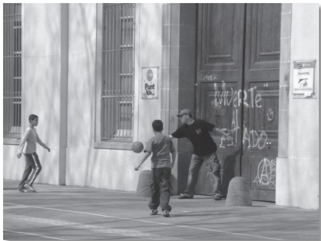
El carácter lúdico con que suelen practicar deporte las familias facilita que se adapten a los elementos urbanos que se encuentran cuando no hay instalaciones deportivas cercanas o están ocupadas.

por ejemplo, los grandes parques o las playas del área metropolitana. A ser posible, prefieren los parques con instalaciones adecuadas para el juego infantil y para prácticas deportivas modernas tales como el baloncesto, el frontón, el fútbol, tenis de mesa, etc. Utilizan los espacios e instalaciones que se encuentran más cercanos a las zonas de vivienda y zonas de paso porque son espacios visibles que dan mayor sensación de seguridad. No obstante, muestran una gran adaptabilidad a diversidad de situaciones, de modo que utilizan distintos elementos urbanos para improvisar campos de juego cuando no hay instalaciones disponibles. 4 En el Parc del Clot muchos padres y madres con sus hijos utilizan las distintas paredes externas de un polideportivo como pequeños frontones mientras esperan su turno para jugar en el frontón central. En el parque del Poble Nou improvisan porterías con distintos objetos empleando a veces, incluso, una canasta de baloncesto como poste de una portería. Otros ejemplos de redes de familias se pueden encontrar en: Jardins de la Infantes, Parc Pegaso, Parc Diagonal-Mar, Pistes Poliesportives Antoni Gelabert, la platja de la Barceloneta, etc.