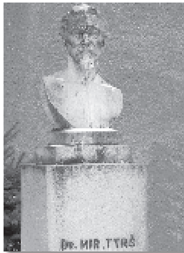
Monument al Dr. Miroslav Tyrs, fundador de l'Orel a Olomouc (República Txeca)