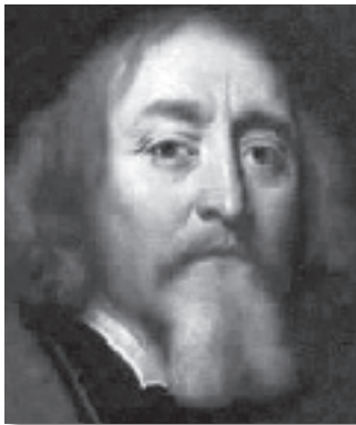
Johann Amos Comenius

El primer pedagog conegut de l'Europa de l'Est que va propugnar l'ús de l'exercici físic com a mitjà educatiu, a l'estil dels grans humanistes de la seva època, va ser Johann Amos Comenius (en txec Kommensky) (1592-1678), el qual va adoptar aquest nom per haver nascut a la localitat