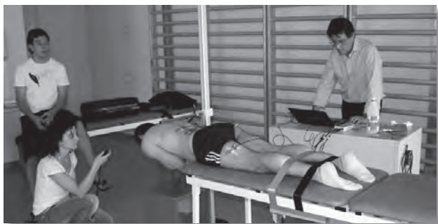
Figura 4 Electromiografía por superficie

mismo (fig. 4). Una vez finalizado el test, se pidió al sujeto que se volviera a poner en la misma posición de reposo para volver a tomar un último registro: reposo postesfuerzo. Tal como se puede ver en el apartado de resultados, no se pudo registrar el glúteo izquierdo por problemas técnicos con el equipo.