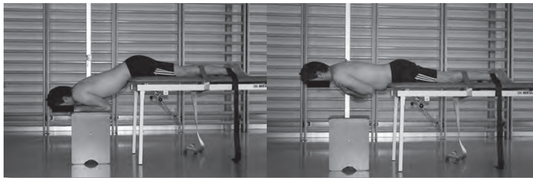
Figura 1 Test de extensión (Sorensen test)

• Test de resistencia de la musculatura extensora (“Sorensen test”) (fig. 1): Individuo sobre la camilla en decúbito prono con el tronco fuera de esta y los brazos apoyados sobre un taburete que le permitan sustentarse sin activar la musculatura extensora. Las crestas ilíacas se encuentran sobre y alineadas con el margen de la camilla. La parte restante del cuerpo se encuentra fijada en la camilla mediante unas correas localizadas al nivel de la parte más prominente del gemelo y el tobillo. Se pide al individuo que abandone el apoyo de los brazos cruzándolos en el pecho y que eleve el tronco hasta su alineación con las extremidades inferiores. Se pide al individuo que mantenga esta posición hasta que no pueda controlarla más o que esta sea intolerante. Para estandarizar el nivel de elevación del tronco durante la realización del test, se evalúa previamente en cada individuo la altura en que se encuentra la parte más prominente (dorsal) de tórax (escápulas o columna) cuando el individuo está totalmente apoyado en la misma camilla en decúbito prono. Esta, pues, es la altura que se pide en el test. El indicador de altura que se utiliza es una barra horizontal sujeta a una estructura vertical que permite el ascenso y descenso sobre esta y, a la vez, ser fijada en el punto que convenga según cada individuo. Se pide al sujeto que durante toda la duración del test no