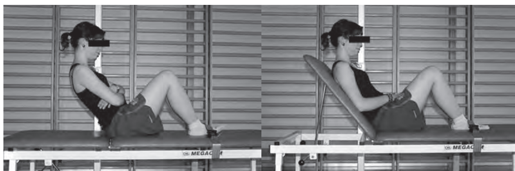
Figura 2 Test de flexión

• Test de resistencia de la musculatura flexora lateral ( side bridge test ) derecha (fig. 3): Sujeto en decúbito lateral sobre la camilla con las piernas estiradas (el pie de la pierna de encima apoyado justo por delante del de