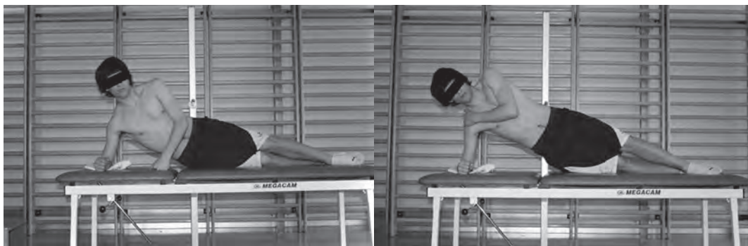
Figura 3 Test de flexión lateral

abajo) y el antebrazo apoyado con el codo justo en la vertical del hombro. Se pide al sujeto que, perdiendo el contacto de la cadera con la camilla, adopte una postura de alineación del tronco y las extremidades inferiores y únicamente apoye los pies y el codo homolateral. El brazo no involucrado en el apoyo se coloca cruzado en el pecho, con la mano sobre el hombro contrario. El test termina cuando se pierde la postura descrita y se vuelve al apoyo inicial (McGill et al., 1999). Para controlar más la posición, aquí también se coloca la barra horizontal. En esta ocasión se coloca a nivel de la cadera, justo a la altura donde la colocación del individuo es una alineación de sus segmentos corporales (cabeza, tronco y extremidades inferiores). Se pide, como en los casos anteriores, que el individuo no pierda el contacto con esta.