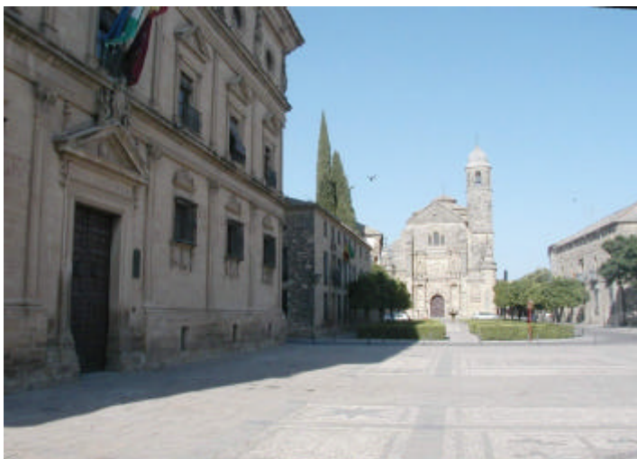
Ilustración 1 Vista general plaza Vázquez de Molina (Úbeda)

Los materiales didácticos, como es norma entre los Gabinetes Pedagógicos de Andalucía, están concebidos con diverso formato, contenido y planteamiento didáctico, para ser utilizados en los diversos niveles educativos; y a la vez ser una propuesta de trabajo abierta en apoyo al currículum escolar actual de Andalucía y a la labor del profesorado desde la Educación Infantil hasta el Bachillerato. Este modelo didáctico elige la visita activa como centro del aprendizaje con el patrimonio e incide en la necesidad de un cambio de actitud y valoración hacia los Bienes Culturales del entorno más cercano.