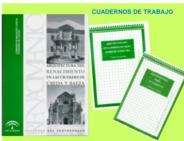
Ilustración 3 Material didáctico elaborado por el Gabinete Pedagógico de Bellas Artes de Jaén.

Cada “Cuaderno de Trabajo” consta de dos cuadernos, uno dirigido al profesorado con consideraciones generales sobre las intenciones educativas de la propuesta. Metodología sugerida. Información específica sobre los contenidos. Material gráfico de apoyo al texto, como planos, plantas de algunos edificios representativos, detalles arquitectónicos, dibujos... Glosario de términos utilizados. Bibliografía utilizada y comentada y Cuestionario de Evaluación sobre el material y la actividad. 7