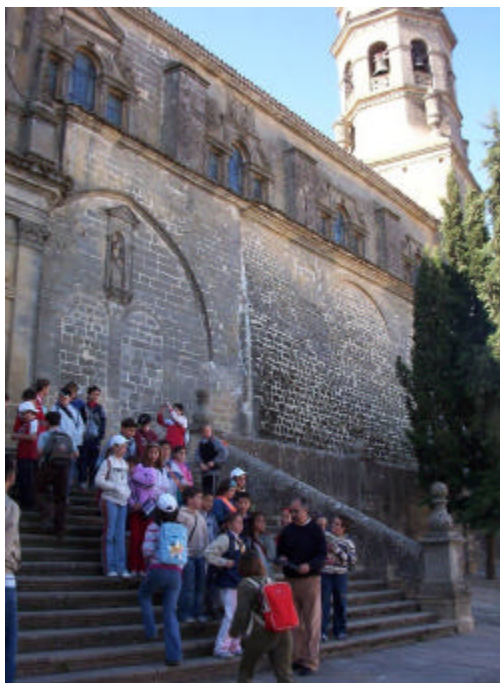
Ilustración 4 Actividades Campaña Escuela y Patrimonio.

El Gabinete Pedagógico de Jaén para apoyar y dinamizar las propuestas didácticas sobre el Patrimonio Histórico provincial planificadas por el profesorado, organiza y coordina todos los años la Campaña Escuela y Patrimonio . Esta campaña, es una de las actividades prioritarias del Gabinete. Está dirigida a todos los centros escolares de la provincia. Tiene como objetivo facilitar el contacto directo con el patrimonio provincial y potenciar las visitas y actividades didácticas durante los recorridos programados por el profesorado en torno al Patrimonio Histórico. Este apoyo se concreta en la subvención de las actividades programadas por los centros, a quienes se les facilita información, material didáctico y el desplazamiento en autobús al lugar patrimonial elegido. Para participar el profesorado interesado presenta un proyecto de actividad, indicando: - objetivos propuestos. - integración de la actividad en el currículum escolar, - nivel educativo y nº de participantes, - fecha de realización, - materiales a utilizar.