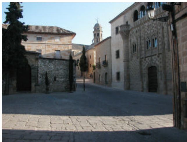
Ilustración 2 Plaza de Santa Cruz y Palacio de Jabalquinto (Baeza)