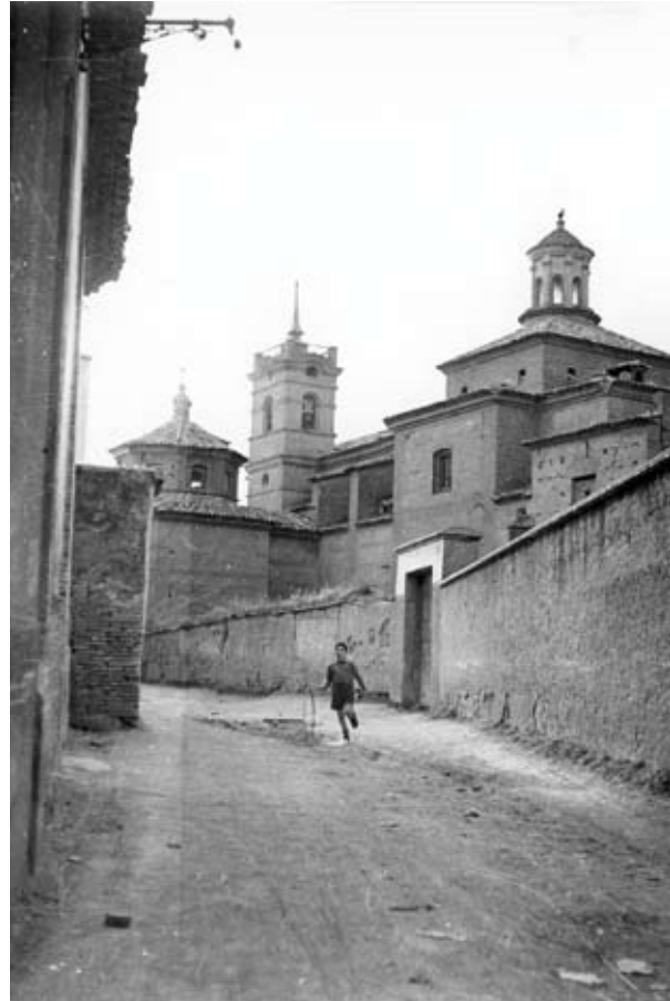
La calle Perena era el límite entre la Morería y el convento de los predicadores, tal como aparece en esta foto de principios del siglo XX.