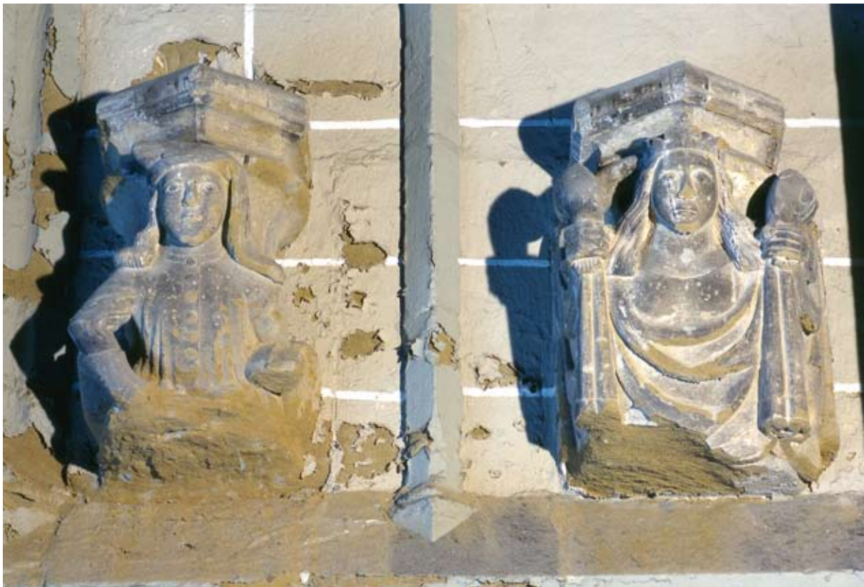
Los únicos restos medievales de edificios religiosos del barrio de la Morería son los que aquí vemos, en la iglesia de San Lorenzo.

En el corazón del barrio se levantó en el siglo XIII, sobre una vieja mezquita, la parroquia de San Martín , que con el tiempo fue la parroquia de los conversos. En el siglo XIX fue derribada para conseguir una plaza que sirviera de recinto ferial (la plaza de los Tocinos). En los límites del barrio se levantaban la parroquia de San Lorenzo y el convento de los dominicos o frailes predicadores, donde hoy está la parroquia de Santo Domingo y San Martín. El espacio que ocupaban estos edificios no es como el actual, las iglesias medievales de San Lorenzo y Santo Domingo eran más pequeñas que los actuales templos barrocos, pero junto a ellas, como en el resto de parroquias, se localizaba su cementerio propio. El convento de predicadores ocupaba una amplia zona que abarcaba no solo la iglesia, sino también el recinto monacal y huertos y dependencias agropecuarias.