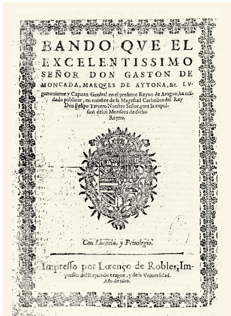
Bando de expulsión

Ejercicio opcional: Actualizar la ortografía.