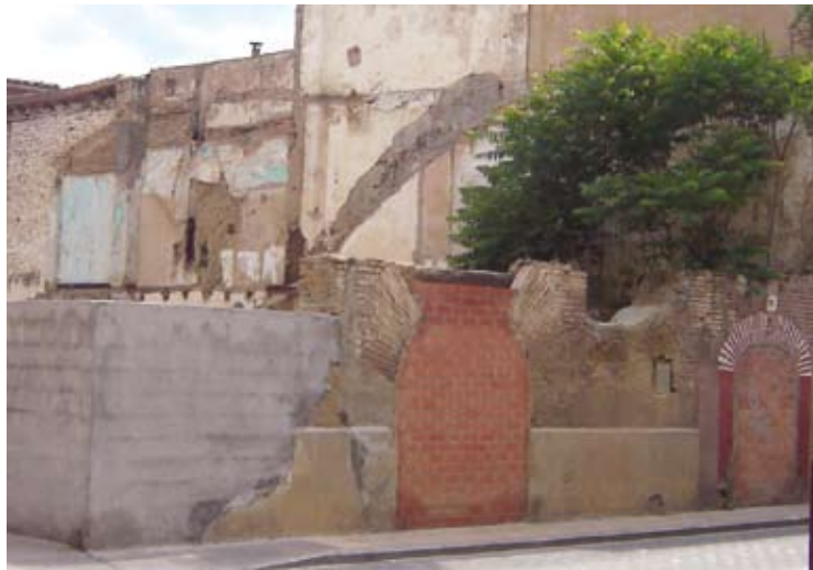
Casas arruinadas en la parte baja de la calle de San Martín, cerca de donde se hallaba hasta la década de 1980 el Chorro de los Moros.