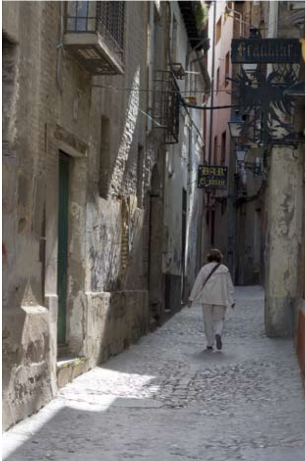
Travesía del Espino. En la foto, el aspecto que podían tener el barrio y las casas en el siglo XVI.