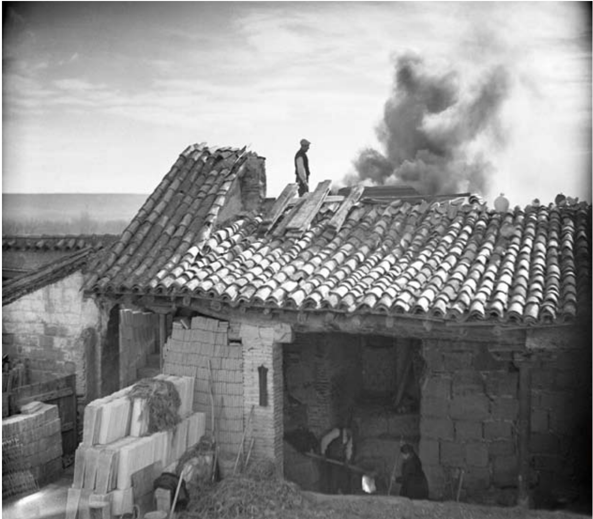
Hasta 1970 siguió funcionando esta tejería-cantarería de los Carrás, sita en la calle Cleriguech, en pleno corazón de la Morería, en el mismo lugar que las había en el siglo XVI

Alejados del barrio ya hemos visto que también había población y posesiones de los moriscos; a las mencionadas habría que añadir las que tenemos localizadas en el camino del Ruiseñor (hoy Ruiseñores), en Algüerdía, en la fuente del Ibón, en la fuente del Ángel, en el camino de Quicena, en el camino de Montearagón, en el camino de Salas, en la plaza de las Monjas (de Santa Clara), cerca de la iglesia de Santa María in Foris, donde en tiempos estuvieron los baños árabes y hoy está el campus universitario, en el antiguo Fosar de los Moros, donde abundaban las eras y los pajares de moriscos en el momento que estudiamos, además de en numerosas otras partidas de la ciudad alejadas de lo que entonces era el casco urbano, como Monzur, hoy Monzú, o Las Mártires, por ejemplo.