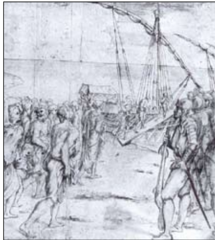
Sanguina de Carducho (s. XVII): Embarque de moriscos expulsados de España

En el verano de 1610 muere la Morería de Huesca; los moriscos que ocupaban el barrio se vieron obligados a abandonar la ciudad y partir al exilio en el norte de África; unos atravesaron los Pirineos para embarcar en Francia, otros lo hicieron en puertos de Cataluña y Valencia.