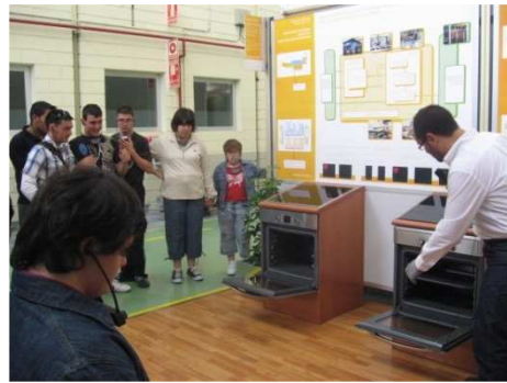
VISITA A BALAY