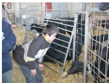
QUESERÍA LA PARDINA