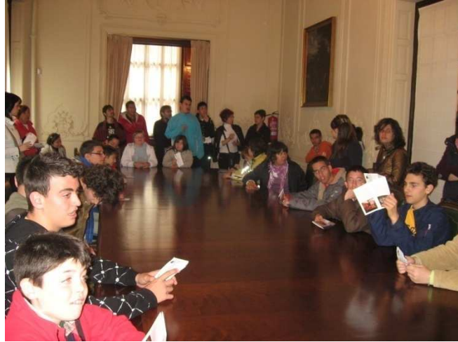
PALACIO DE LARRINAGA