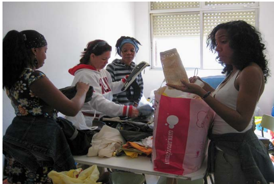
Recogida del Material