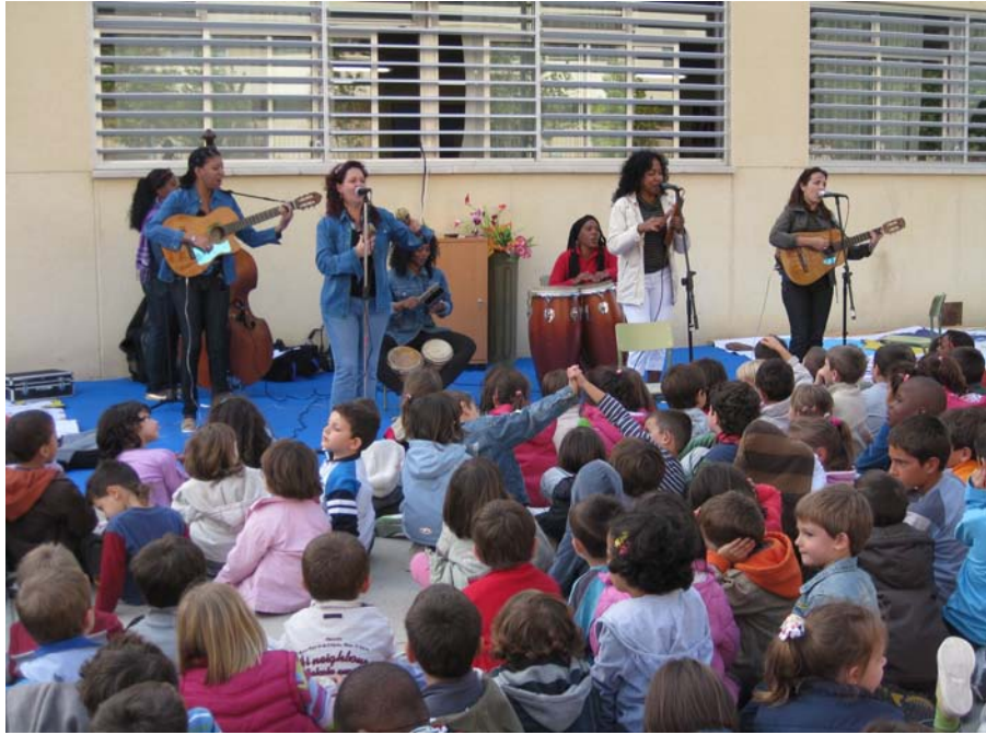
Concierto “MORENAS SON”