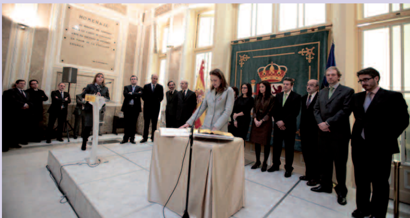
Montserrat Gomendio, secretaria de Estado de formación profesional, durante su toma de posesión.

Si nos fijamos bien, los 12 estados que tienen una enseñanza comprensiva hasta los 16 años se caracterizan por ser países de poca población y bastante homogénea (el caso de los nórdicos). Los estados que terminan la comprensividad antes de los 16 años son los que tienen un tamaño y población más heterogénea y