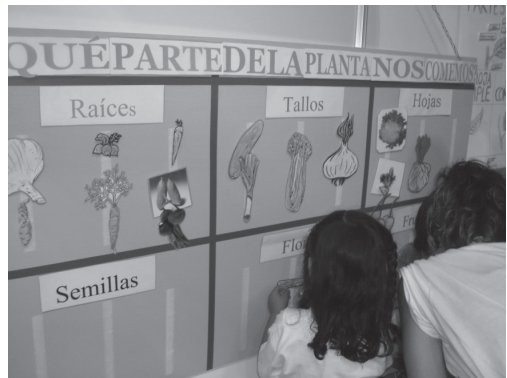
Investigación 4. ¿Y tú quién eres? (2º y 3º de Primaria)

Puede verse en la foto que sigue el magnífico aspecto del panel elaborado por la clase, que recibió muchos elogios de los escolares y profesores de otras clases.