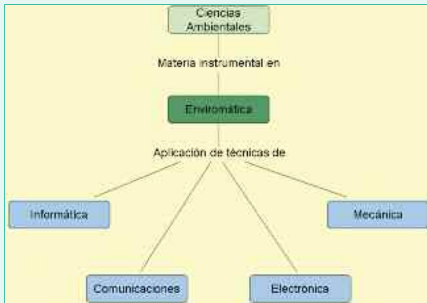
Figura 2. Ubicación de la enviromática como disciplina

Es importante mantener una visión holística de la disciplina, ya que no se trata de una superposición de aplicaciones. El manejo ambiental tiene unas características propias que condicionan de forma general las aplicaciones. Ésta es una de las razones por las que se pueden tratar en conjunto como una disciplina unitaria. La experiencia desarrollada en un ámbito temático (p.ej. estudio de la flora), en un área geográfica (p.ej. la comarca rural de Los Vélez), y con un cierto obje-