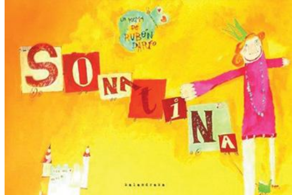
Portada del libro "Sonatina" de Rubén Darío.