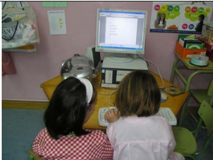
Pensando palabras que lleven L.

Muy satisfactoria ya que se trata de una actividad motivante para los alumnos.