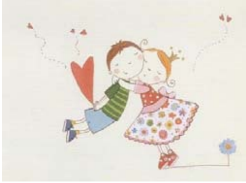
Portada del libro "Besos y achuchones" de Alicia Borrás.