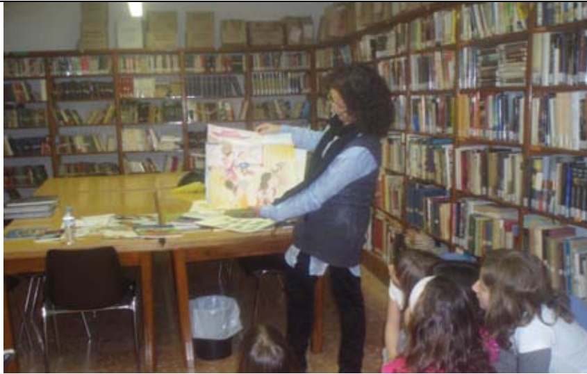
Ilustraciones de los libros de M a Teresa