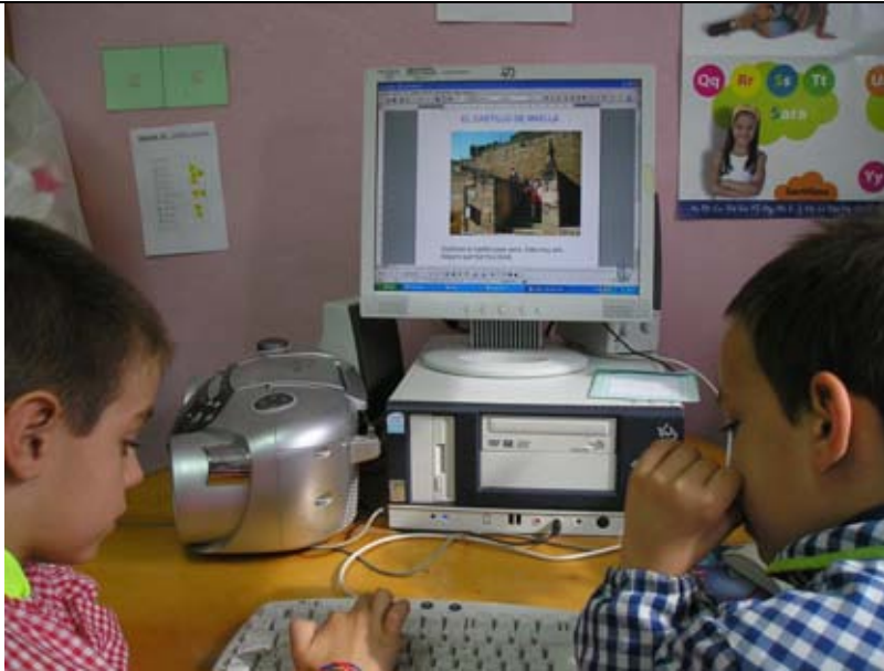
Los niñ@s de 5 años escriben sobre el castillo de Maella.