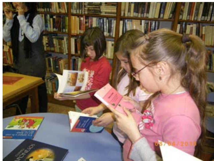
Estos son los libros escritos por ella.