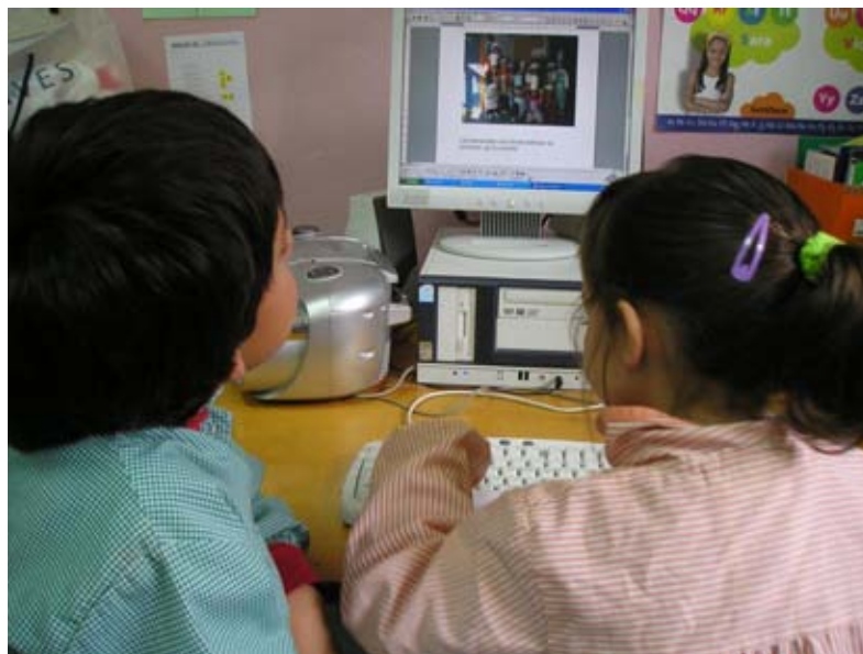
Aquí escriben sobre la celebración del Carnaval.