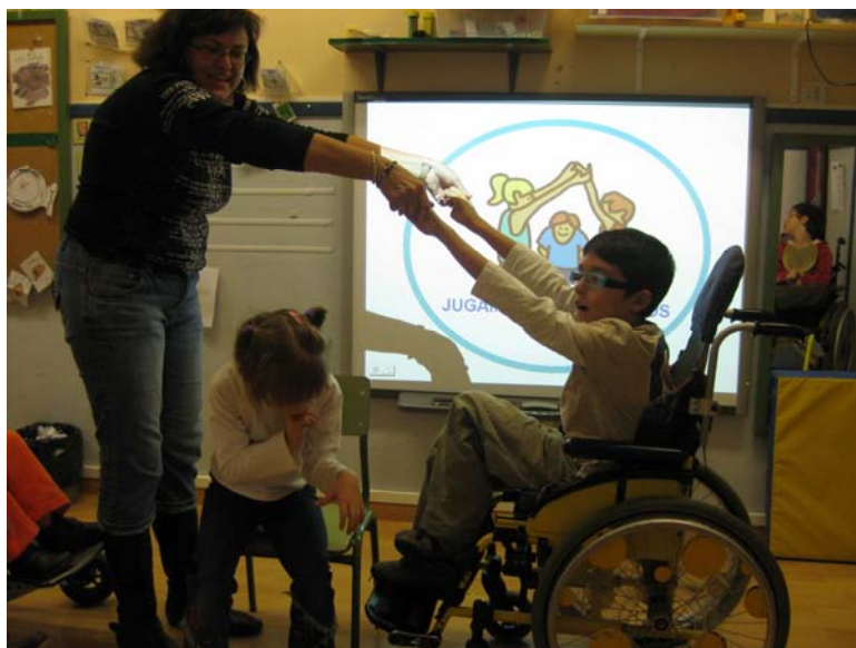
Representamos el anagrama de los Juegos Cooperativos

Uno a uno, los alumnos/as cogen su nombre y lo colocan en el mural alrededor del pictograma del taller y después colocamos el lema: “Jugamos todos juntos”.Luego elegimos un pictograma de los que hay en una lista y si esta relacionado con la convivencia, lo colamos también en el mural. Al final, todos los pictogramas estaban relacionados, y colocamos el mural en forma de nube en el hall de arriba.