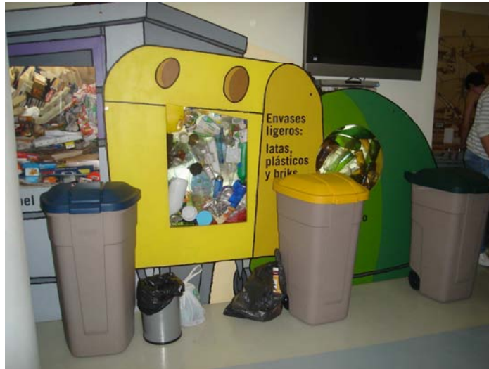
Visitamos el Aula de Medio Ambiente

Nos convertimos en detectives y aprendimos a reciclar bien, repasamos los diferentes contenedores de reciclado, nos enseñaron algunas cuestiones relacionadas con el ahorro de energía en casa, donde tenemos que echar la basura,...., Resulto una salida muy interesante y funcional, en la que aprendimos cosas que podemos poner en práctica en la vida diaria.