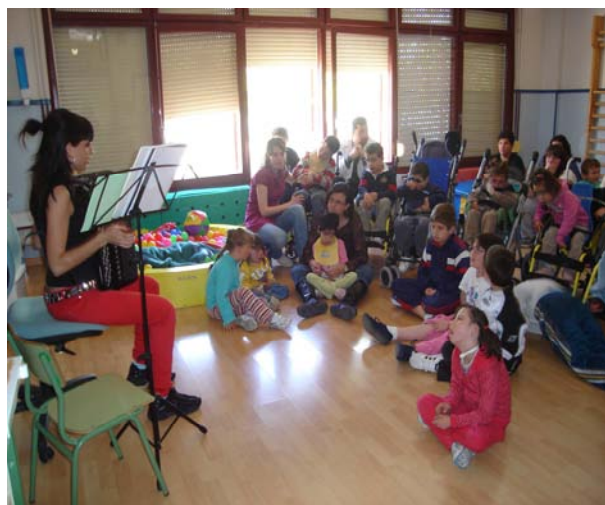
Asistimos a un concierto de acordeón