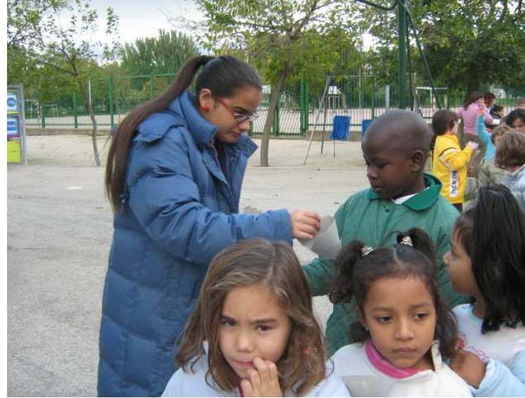
Los mayores nos dan un cucurucho para las castañas

Esa misma semana pasamos la tutora del Aula 3 y la orientadora junto con los dos alumnos que asisten a actividades en la jornada escolar en el CP Calixto Ariño para invitar a los alumnos/as de Infantil y 1º para invitarles a la Castañada. Les llevamos una invitación en papel para que la pusieran en un sitio visible y se acordaran. Al final pasaron todos menos los niños/as de 3 años.