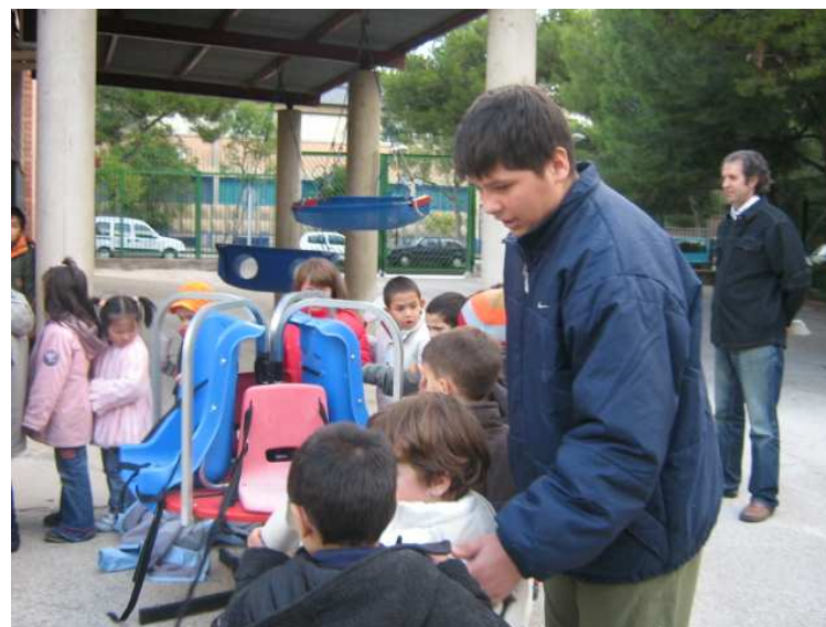
Esperamos en fila y los mayores nos ayudan