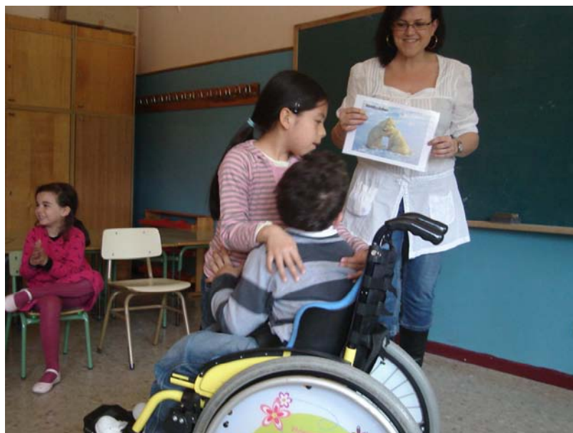
Imitamos una foto