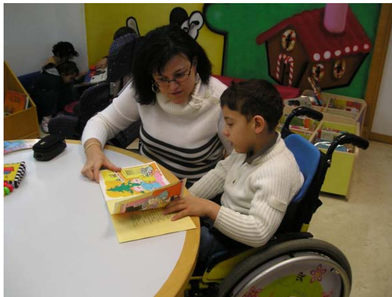
Leemos juntos libros

También hemos aprendido las normas de comportamiento que tenemos que guardar en una biblioteca (no hablar alto ni chillar, pedir un cuento o cogerlo con ayuda de un adulto,...) y sobre todo, hemos contribuido a desarrollar el interés por la lectura y escucha de cuentos y libros sobre temas muy variados: animales, astronomía, Egipto,..., dentro de un ambiente lúdico y motivador. Algunos libros los pedimos en préstamo y nos los podemos llevar a casa.