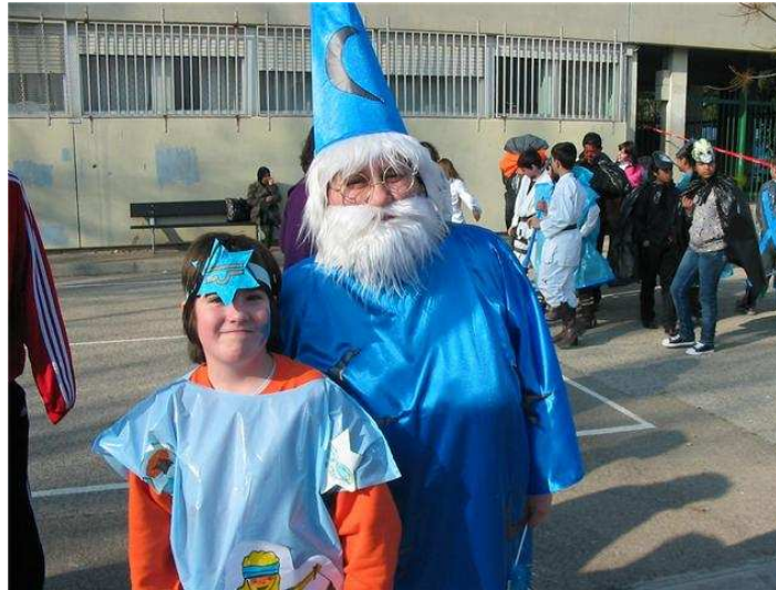
Nos disfrazamos en el Carnaval del CP Calixto Ariño

i.- Toques de tambor de Semana Santa en el CP Calixto Ariño. Coincidiendo con la Semana Santa, acudimos a la invitación que nos hace el CP Calixto Ariño todas las clases del colegio menos una para disfrutar de una exhibición en directo de toque de tambor y bombo en su recreo. La cofradía se retraso un poco por lo que aprovechamos para hablar y jugar juntos más tiempo. Al final nos dejaban tocar los instrumentos, pero no pudimos aunque teníamos ganas porque habían llegado ya los autobuses y nos teníamos que ir. Nos gusto mucho.