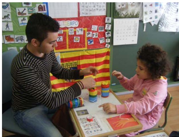
Construimos instrumentos musicales con materiales de reciclado