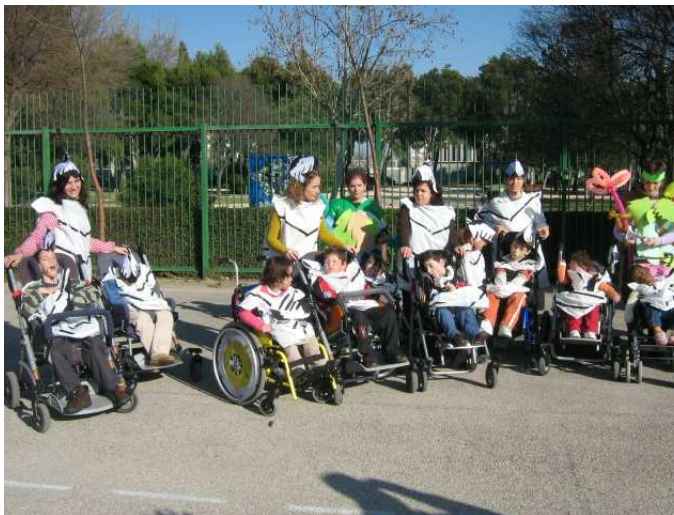
Algunas cebras de las Aulas 1 y 2

Carnaval de dicho colegio disfrazada con el disfraz que hizo con sus compañeros/as en clase, como se recoge en las actividades en común.