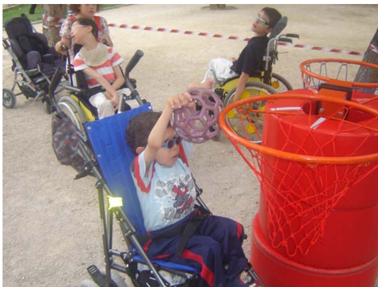
Encesto y ...¡canasta!