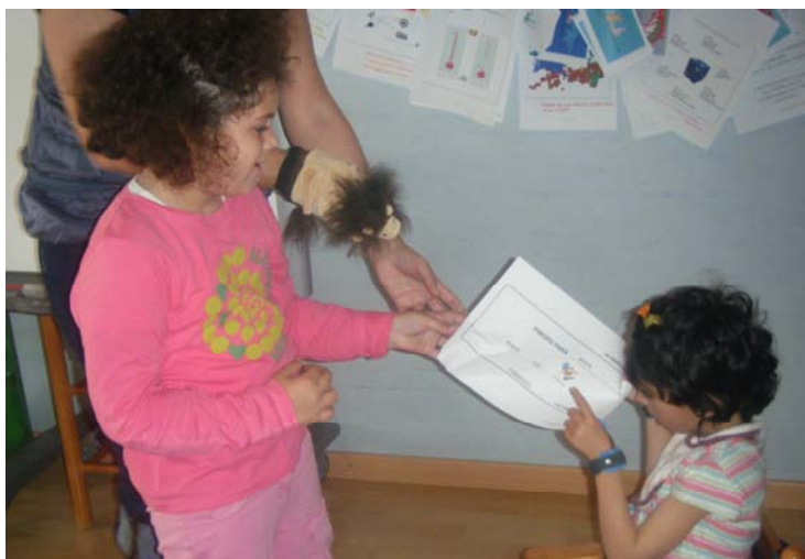
Entrega de piropos entre compañeros/as