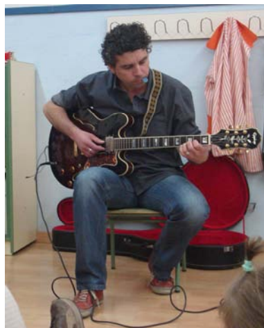
Y también a un concierto de guitarra eléctrica