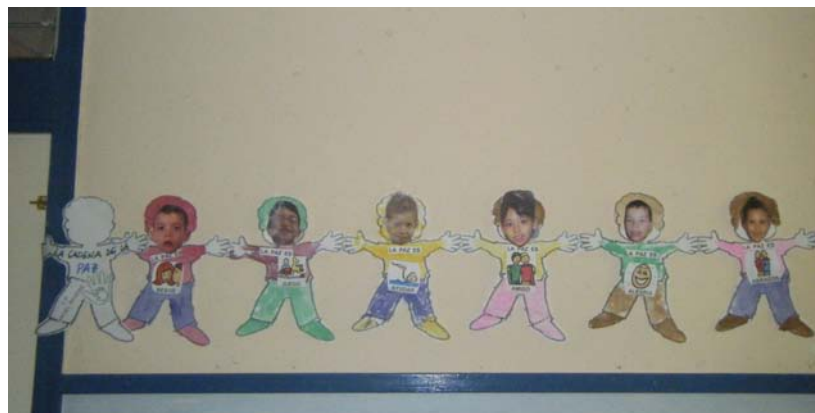
Cadena de la Paz de un Aula

ciclo pensamos propuestas para trabajar y celebrar en común con el CP Calixto Ariño y se las transmito a la coordinadora del proyecto de convivencia en dicho centro, pero al final quedan para el curso próximo.