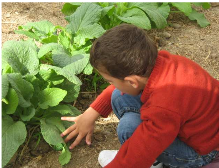
Cogemos hortalizas del suelo en el invernadero

Aunque ya hemos ido otras veces, a los alumnos/as les sigue motivando mucho visitar la granja escuela, plantar una planta y llevársela a casa, ver y tocar a los animales, montar en burro,....., actividades que este año se han ampliado con la recogida de productos de la huerta directamente del suelo en el invernadero. La visita ha permitido repasar y afianzar contenidos trabajados previamente en las aulas y preguntar algunas dudas que teníamos sobre los mismos, y ha sido valorada satisfactoriamente por los niños/as y profesionales que hemos estado implicados en la misma, agradeciendo el excepcional trabajo de los guías de la granja escuela, como así se lo comunicamos.