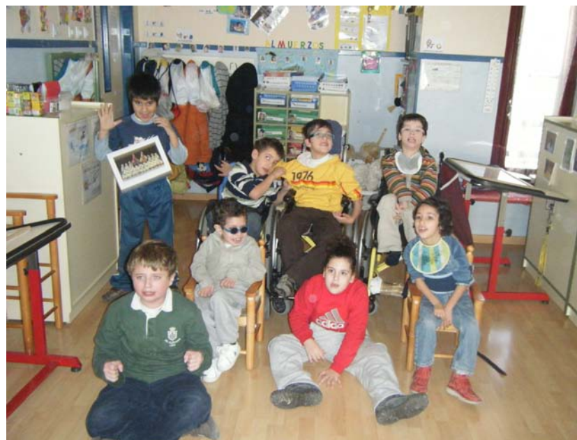
Imitación de una imagen foto

Dedicamos otra sesión, el 5 de Noviembre, para repasar la actividad de imitar fotos. En Noviembre, el 26, el Aula 3, y dos alumnos del Aula 4 visitamos el CP Ángel Escoriaza de la Cartuja, y realizamos estas mismas actividades con nuestros amigos los chicos/as de 2º. Nos gusta mucho visitar a nuestros amigos, a los que conocíamos por carta, y los juegos cooperativos han permitido establecer un primer contacto e interacción con ellos.