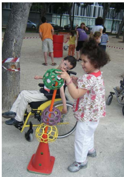
En la zona de canasta

En cada zona los encargados de las mismas son los tutores/as que les toca estar en cada momento en la misma, salvo en la zona 1 que el encargado es el profesor de educación física.