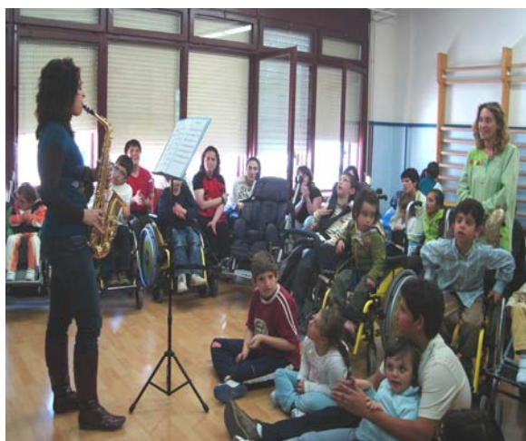
Asistimos a un concierto de saxofón

Para cerrar la Semana disfrutamos de unos conciertos de guitarra, saxofón, tambores y acordeón por parte de profesores o conocidos que tocan dichos instrumentos y se acercan al colegio. La exposición permanece una semana más ya que nos ha gustado mucho y ello permite que todos los alumnos/as puedan acudir con la profesora de música a la misma.