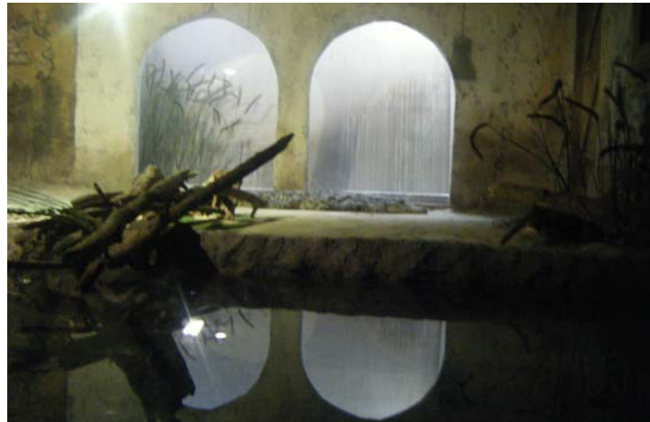
El cocodrilo del Acuario

g.- Visita al Acuario de Zaragoza . En Marzo acudimos todos los alumnos del colegio al Acuario de la Expo de Zaragoza. Esta visita está relacionada con el tema del trimestre que estábamos trabajando en clase: el gorila y los animales salvajes, y nos pareció una buena idea para reforzar y ampliar los aprendizajes del aula visitar al cocodrilo del Acuario. Ya habíamos estado el año anterior, cuando visitamos la Expo, pero ahora había menos gente y se podía ver todo mejor. Además, habíamos trabajado el tema en clase y ello nos ayudo a comprender mejor la visita. Pudimos ver; las nutrias, peces, pez payaso, una anaconda gigante que mudo la piel, y también el cocodrilo. Esta vez había carteles, pero a veces estaban colocados muy arriba, otras veces lo que estaba arriba eran las peceras y desde las sillas no podíamos ver bien los peces. Algunos tuvimos miedo cuando vimos al cocodrilo. Nos gustaron mucho otros peces como el pez gato y el pez payaso.