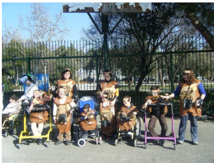
El Aula 3 en el Carnaval