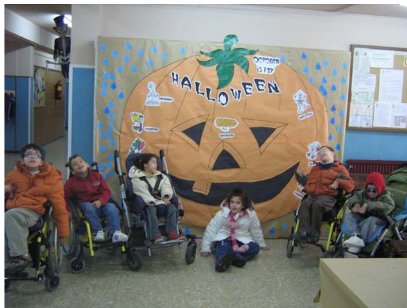
Con la gran calabaza de Halloween