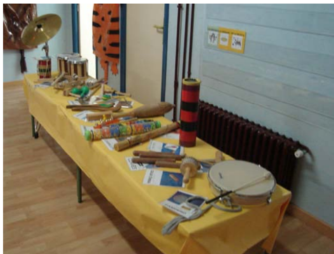
Exposición de instrumentos musicales

niños/as puedan observar, ver, tocar y experimentar con los instrumentos musicales, es decir, vivenciarlos. Montamos la exposición en la entrada al colegio, y junto a cada instrumento colocamos su foto, pictograma y nombre. Algunos pictogramas los tenemos que inventar ya que pertenecen a instrumentos no convencionales o menos conocidos. Los alumnos/as podrán tocar los instrumentos solo cuando estén con la profesora de música o con un adulto en la exposición, norma que respetan todos. La profesora de música ha acudido en sus clases con los alumnos a la exposición, comentándoles como se llaman, como se tocan, tocarlos juntos,... También se han elaborado instrumentos de música con elementos reciclados que traen los alumnos/as de casa.