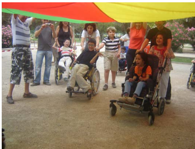
Jugamos bajo el paracaídas