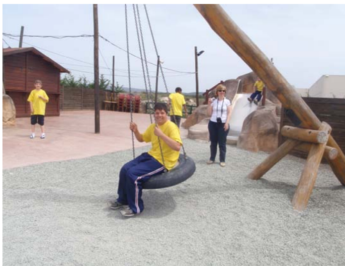
En la zona de juegos