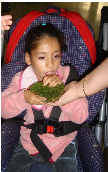
Nos gusta tocar el musgo