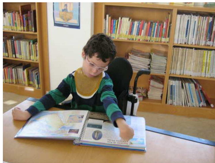
Leemos muchos libros de todo tipo

Por problemas de cambios de fechas a última hora, este año los bibliotecarios no pudieron venir al colegio a contarnos el cuentacuentos, actividad que si que continuaremos el proximo curso. Algunas veces la visita a la biblioteca ha coincidido con otra actividad socializadora o salida, y si no se ha podido cambiar la fecha de la misma, hemos tenido que anular la visita, aunque han sido muy pocas veces.