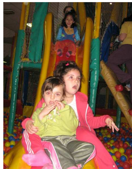
Bajamos por el tobogán