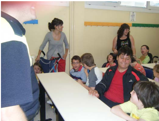
Escuchamos las explicaciones y respondemos a las preguntas

k.- Visitas a Tráfico . Como el año pasado, hemos realizado una visita a Tráfico, donde nos explicaron normas básicas de educación y seguridad vial, nos enseñaron un video de señales, y lo más divertido, nos montamos en cars, jeeps, bicis, ... Nos gusto muchisimo esta salida y volveremos el proximo curso.