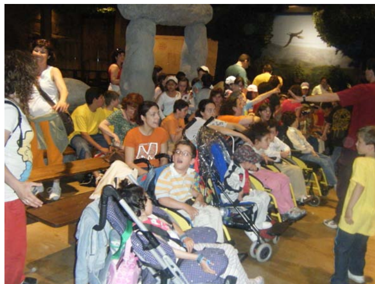
Esperando en el club de los paleontólogos