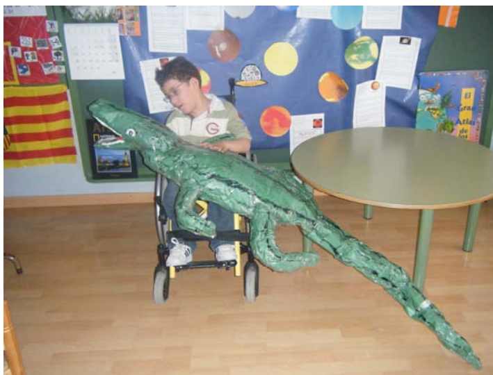
Con nuestro cocodrilo amigo en el colegio