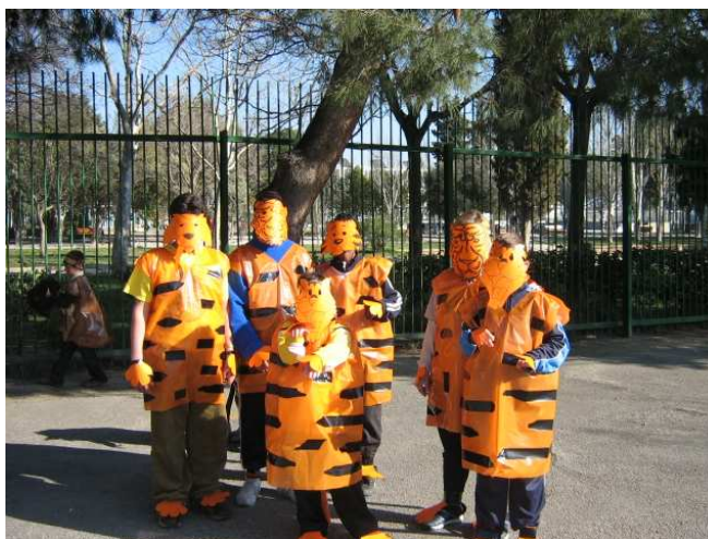
Los tigres del Aula 6

Después del desfile organizado de cada una de las clases nos mezclamos en el patio de recreo las cebras, leones, tigres y monos. Terminamos el baile bailando el baile del gorila. La alumna que asiste a 4º en el CP Calixto Ariño paso al día siguiente al