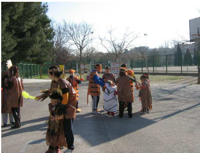
Un momento de juego entre los monos, tigres y cebras en el recreo