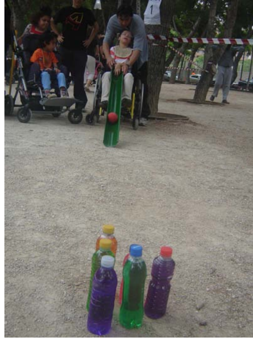
Jugando a la boccia

Establecimos el orden que seguía cada grupo en las distintas zonas, terminando todos juntos en la zona de paracaídas. Ha sido una actividad que hemos hecho este año por primera vez y en la que los niños y profesionales nos relacionamos, además de con los niños de la otra clase con la que formábamos grupo, con todos los niños y profesionales del colegio, a lo que ayudo la actividad del paracaídas, planteada para todos.