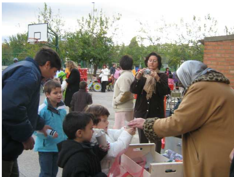
Cogemos las castañas