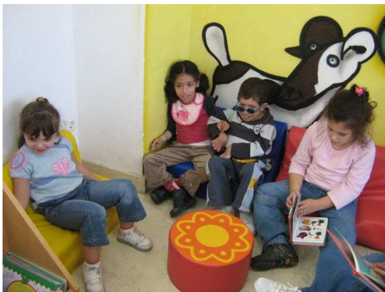
Contamos cuentos en el rincón de los pequeños