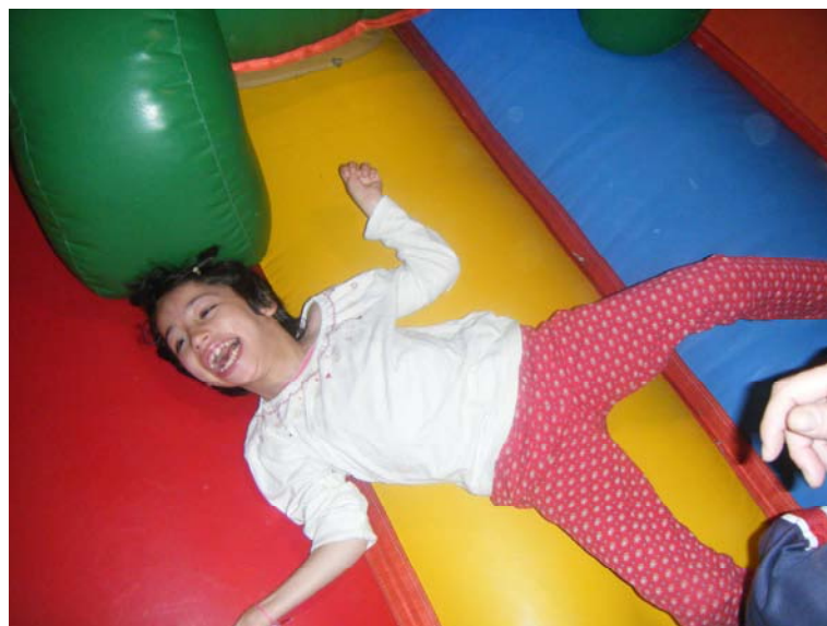
Disfrutamos mucho en los hinchables