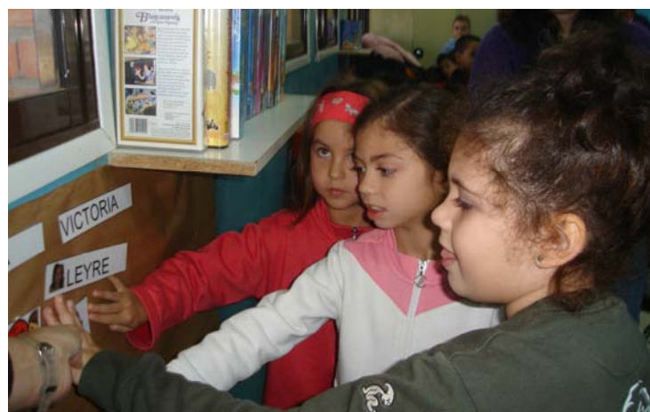
Colocamos nuestros nombres en el mural de la amistad

Ese mismo día realizamos una segunda sesión del Taller de Juego Cooperativo: la imitación de fotos de animales. Proyectamos fotos de animales, pedimos un voluntario de cada colegio, y por parejas, tienen que imitar lo que hacen los animales