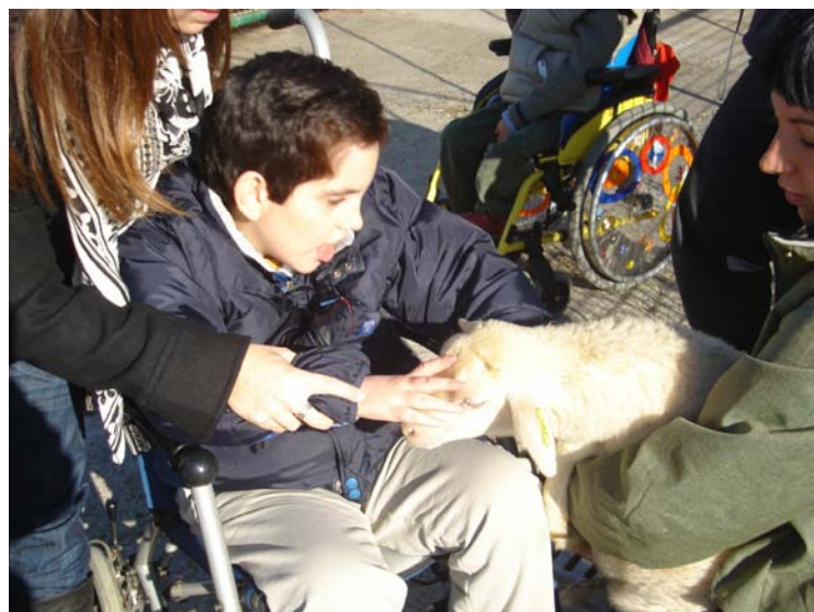
Acariciamos un animal