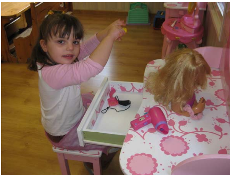
Jugamos en la peluquería de la ludoteca

Nos gusta mucho ir a la ludoteca porque nos lo pasamos muy bien, podemos interactuar y jugar juntos con compañeros/as de otras clases y pasamos toda una mañana muy amena. Además, podemos jugar todos juntos en los rincones y actividades que hay en la ludoteca.