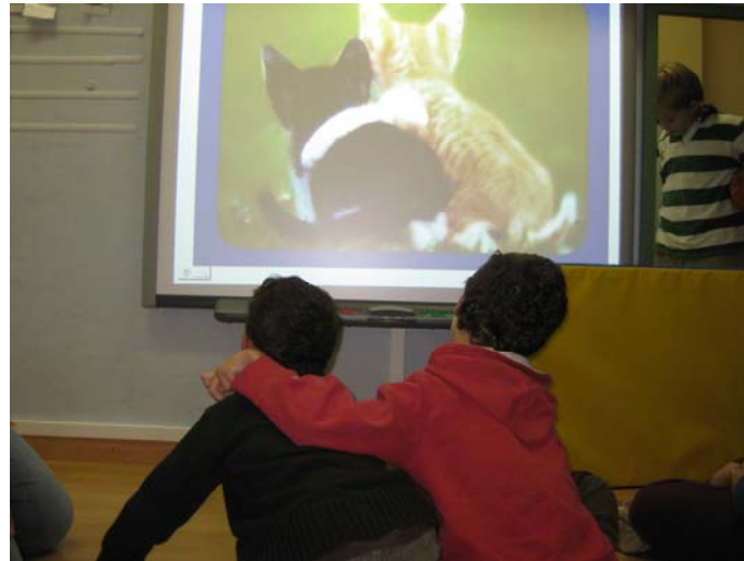
Imitación de una imagen foto

otro, y la ultima foto en la que aparecía una familia de gallo y gallinas con muchos polluelos, foto en la que participábamos todos como modelos.