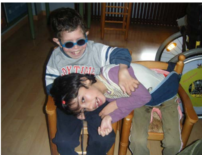
Nos sentimos bien después de leernos los piropos