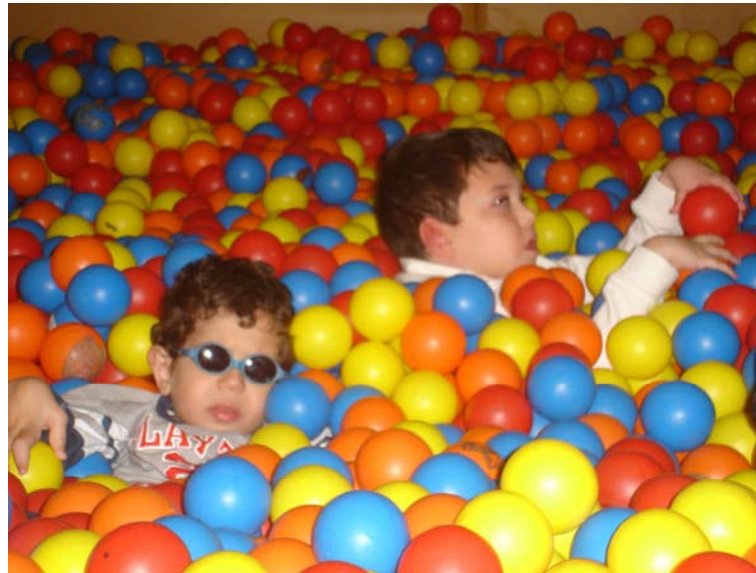
Nos bañamos en la piscina de bolas de colores

j.- Salida al Parque de Juegos Psicomotores “Indiana Hill” . Este curso fuimos como en otros anteriores a Indiana Hill, que es un parque de juegos psicomotores y sensoriomotores que nos gusta siempre mucho. Nos dimos un baño en la piscina de bolas, botamos en los hinchables, bailamos en la disco y nos montamos en un montón de formas, además de recorrer circuitos y trayectos muy difíciles con ayuda de los adultos. Volveremos el proximo curso.