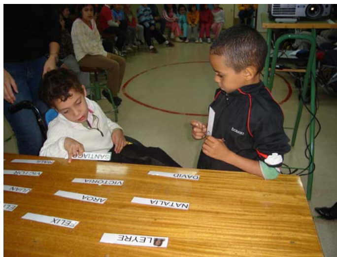
Elegimos nuestro nombre por parejas