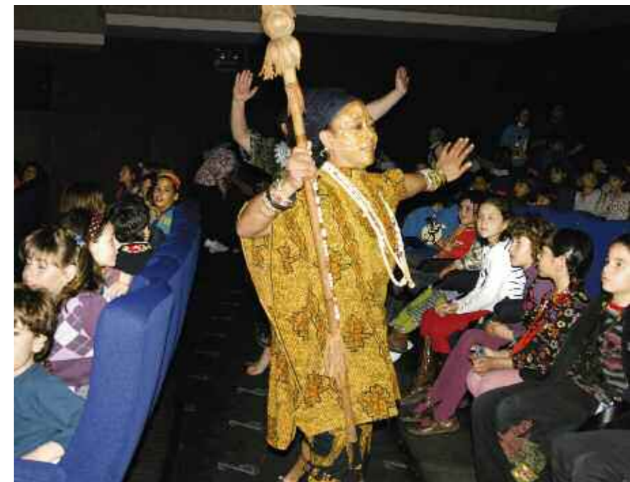
Espectáculo de animación previo a la proyección de la película Kirikú y la bruja

Toda la información relativa a este club se realiza con los medios de comunicación que les son propios a sus miembros: sms, correos electrónicos, internet... Para