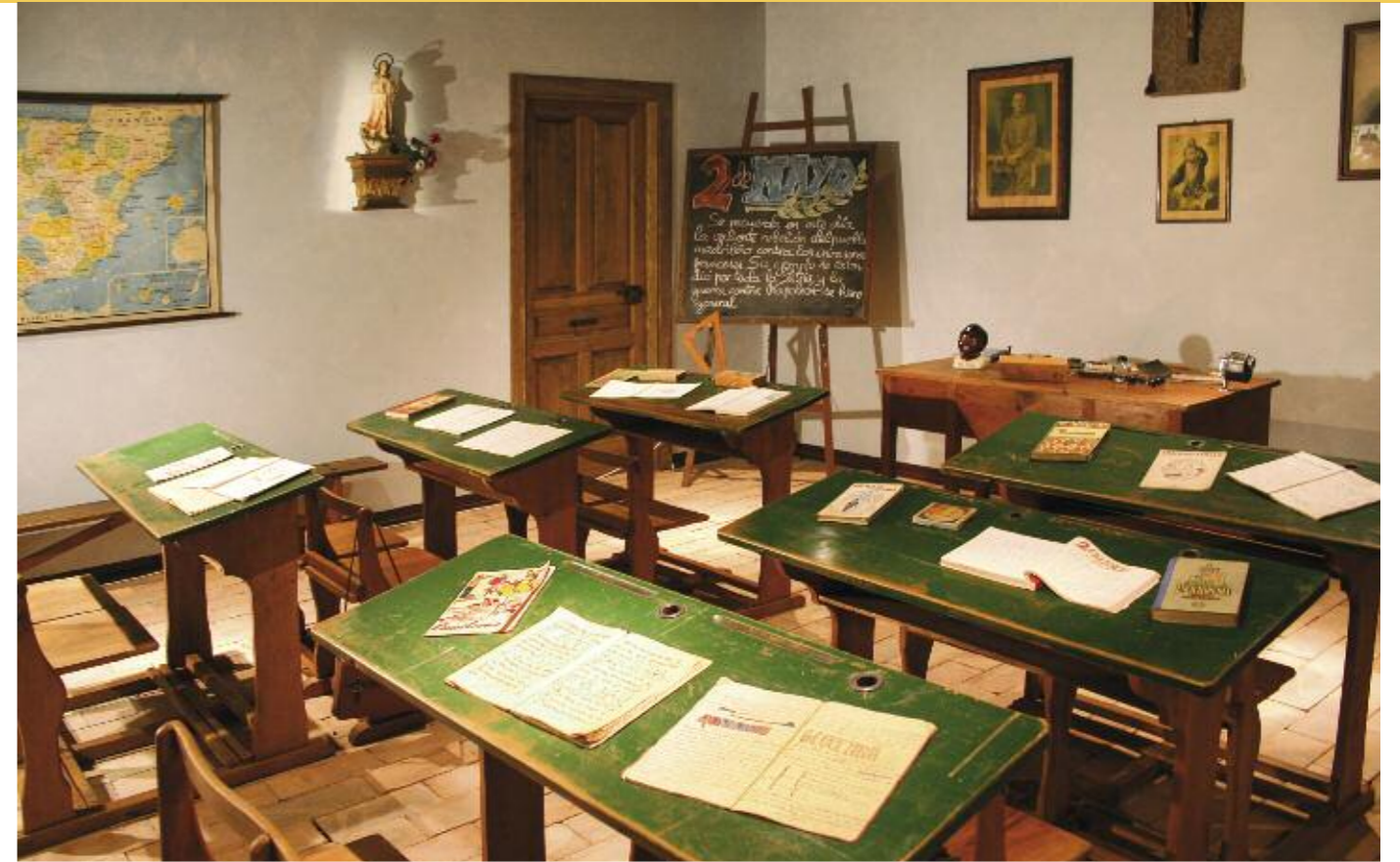
Aula del nacional-catolicismo