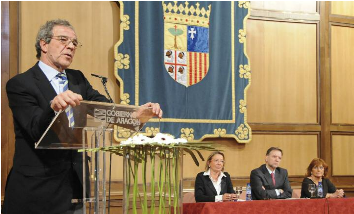
César Alierta, Presidente Ejecutivo de Telefónica S.A. durante el acto de la entrega de medallas del pasado año