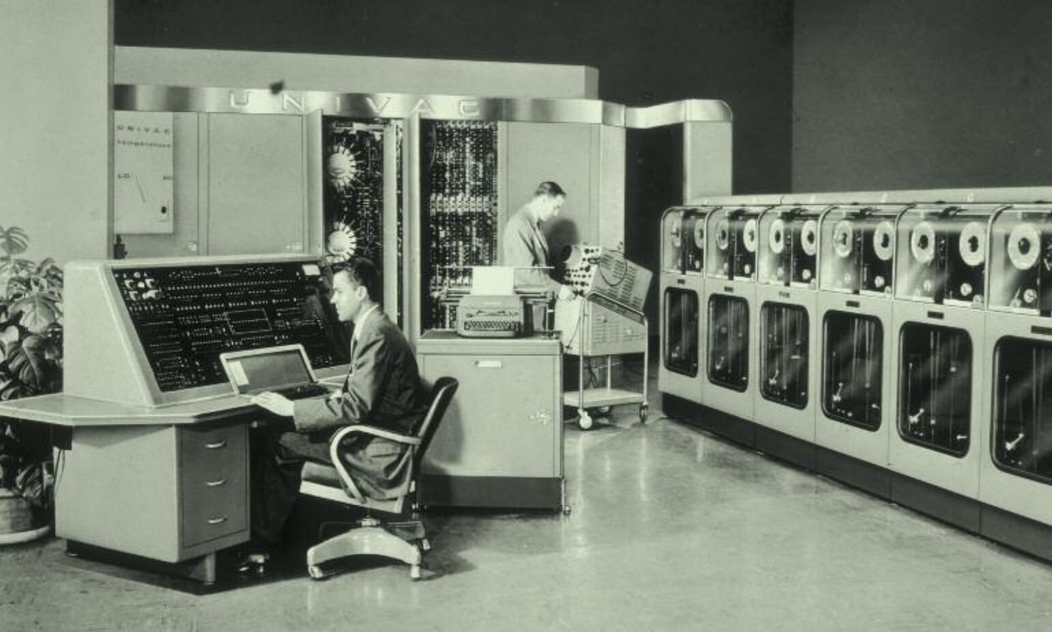
UNIVAC I (Universal Automatic Computer I). Estados Unidos, 1951