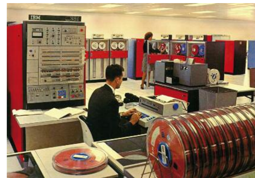
IBM S/360, 1964

Sin duda alguna, todos ellos son retos que conviene ir incorporando a nuestros sistemas educativos mediante políticas educativas que establezcan marcos de actuación que faciliten este tránsito hacia nuevas maneras de hacer en los centros y en las aulas.