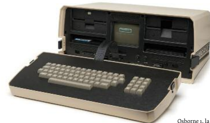
Osborne 1, la primera microcomputadora portátil, 1981

(docentes, directores, consejeros pedagógicos, responsables tecnológicos).