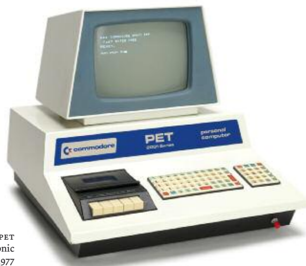
Commodore PET (Personal Electronic Transactor), 1977