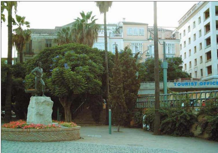
Plaza de la Marina, en el lugar donde se encontraba la calle natal de José Moreno Villa

Tercera parada: JOSÉ MORENO VILLA (1887-1955)