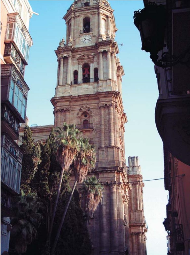
Catedral de Málaga, en la que fue enterrado José María Hinojosa

Séptima parada: JOSÉ MARÍA HINOJOSA (1904-1936)