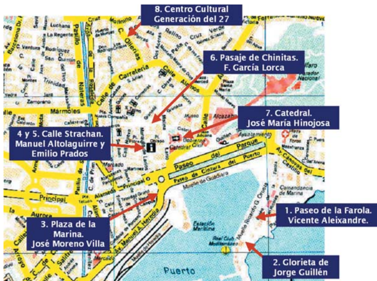
Plano: Itinerario del paseo literario por la Málaga del 27