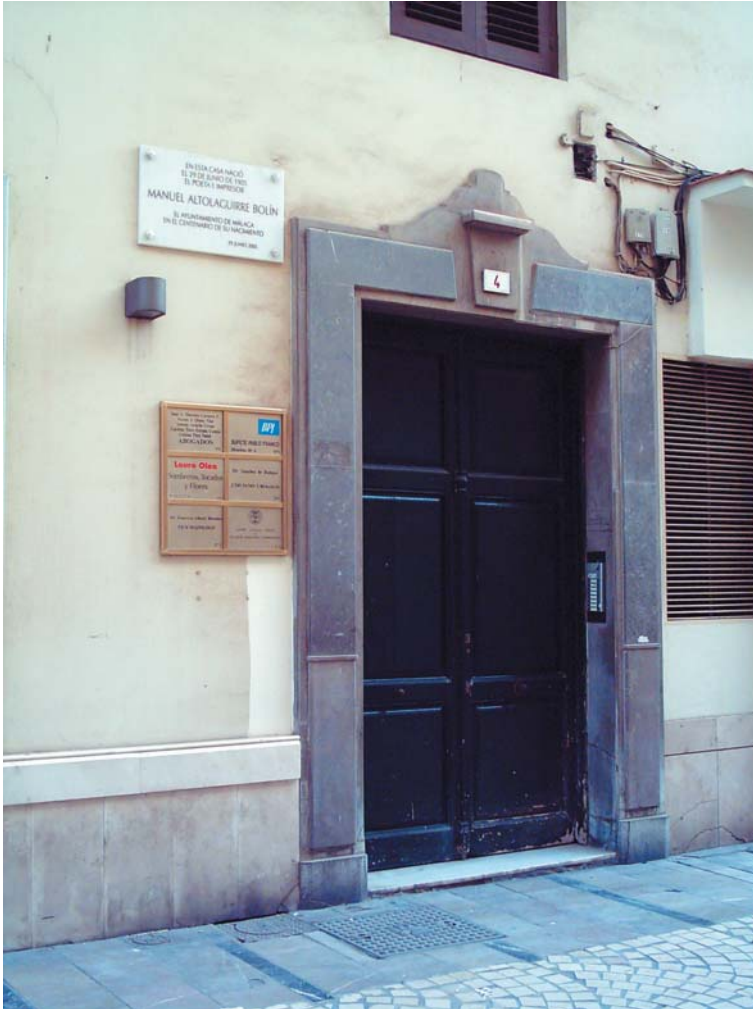
Casa natal de Manuel Altolaguirre en el número 4 de la calle Strachan

Cuarta parada: MANUEL ALTOLAGUIRRE (1905-1959)