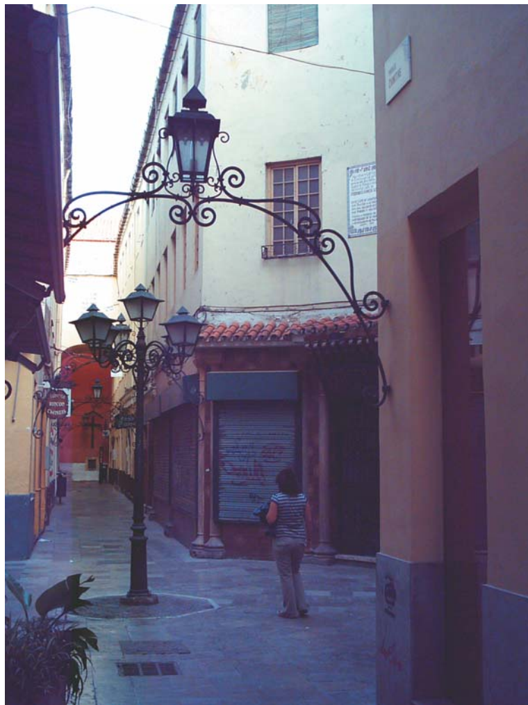
Pasaje de Chinitas, en el que estuvo el antiguo Café de Chinitas

Sexta parada: FEDERICO GARCÍA LORCA (1898-1936)