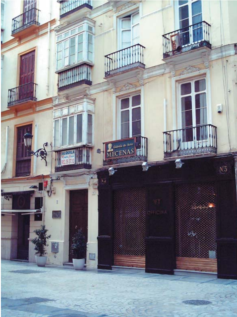
Casa natal de Emilio Prados en el número 7 (antiguo número 3) de la calle Strachan

Quinta parada: EMILIO PRADOS (1899-1962)