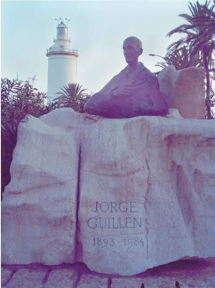
Monumento a Jorge Guillén en la glorieta que lleva su nombre

Segunda parada: JORGE GUILLEN (1893-1984)