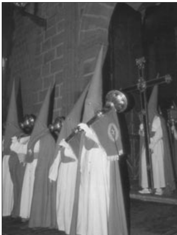
Las Cofradías adquieren un papel fundamental en la celebración de la Semana Santa. Cofradía de la Semana Santa de Jerez de los Caballeros (Badajoz).