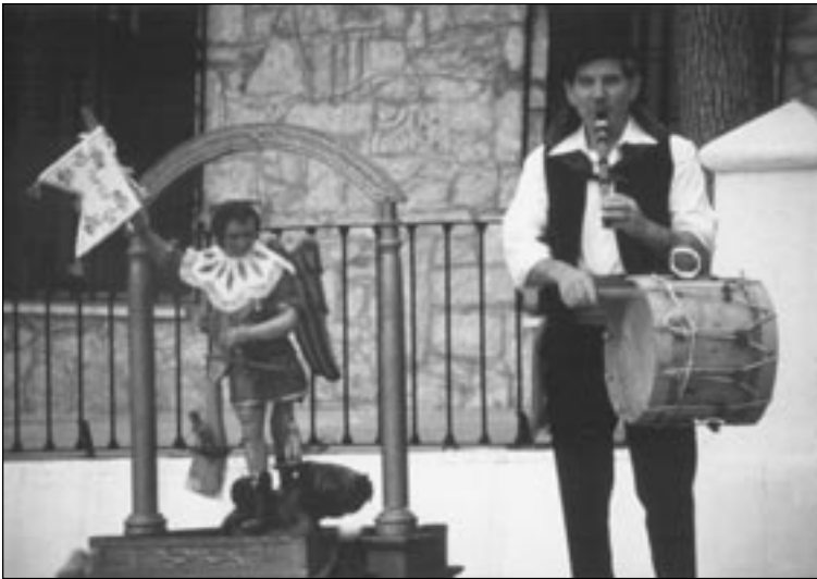
Ofertorio de San Miguel Arcángel en Torrejón el Rubio (Cáceres). La jota en honor al Santo se baila al ritmo de los sonos del tamboril y la flauta.