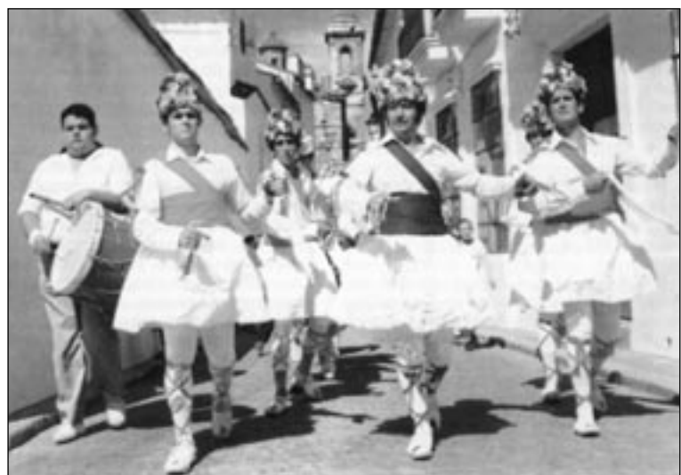
Los Lanzadores de la Virgen de la Salud de Fregenal de la Sierra (Badajoz).