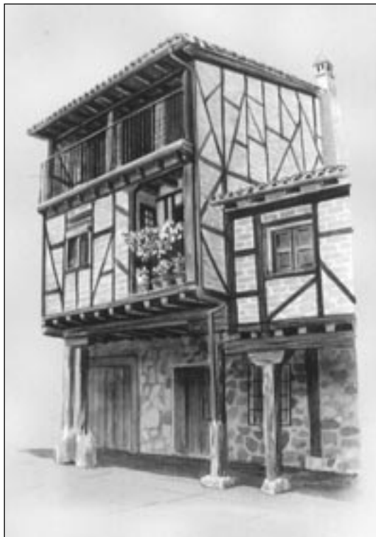
Casa típica de La Vera (Cáceres).