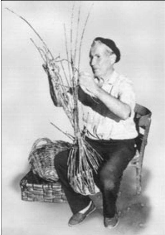
Hombre trabajando el esparto.