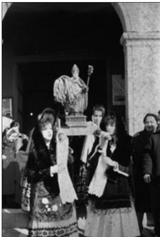
Procesión de San Blas en Torrejón el Rubio (Cáceres), 3 de Febrero. Las jóvenes ataviadas con trajes regionales que portan la imagen son las encargadas de cantar en la misa las Coplas en honor al santo.