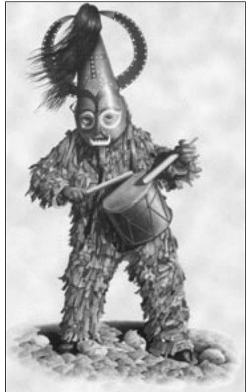
El Jarramplás de Piñal (Cáceres). Lo religioso y lo profano conviven en la cultura festiva extremeña.