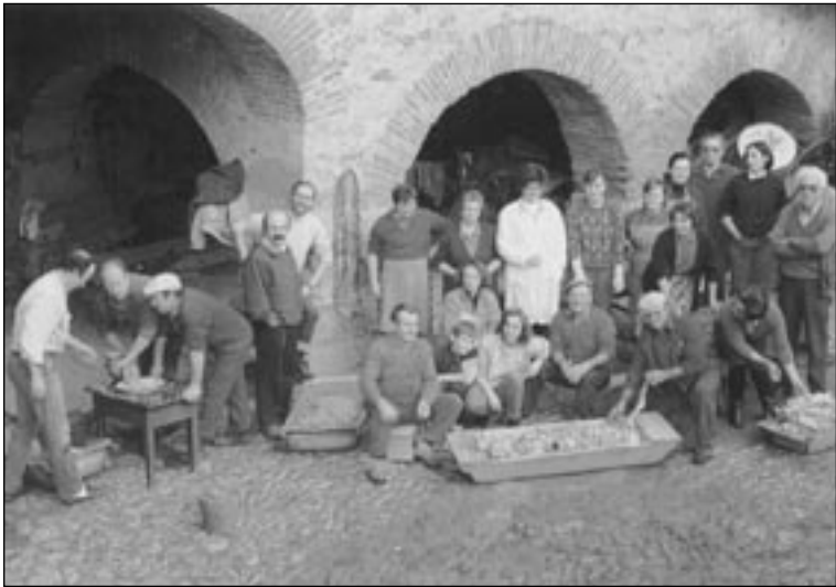
La matanza como acto social.