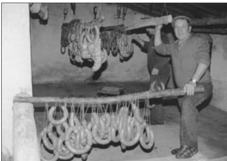
Conservación de los productos del cerdo.

(...) Durante los días de matanza las comidas se ritualizan con platos prescritos por la tradición, que van de la sopa de cachuelas o el arroz con magro al frite de chichas , mintraños o pipiernos , pasando por la ensalada de grano, el pote de patatas o la inexcusable caldereta ". 15