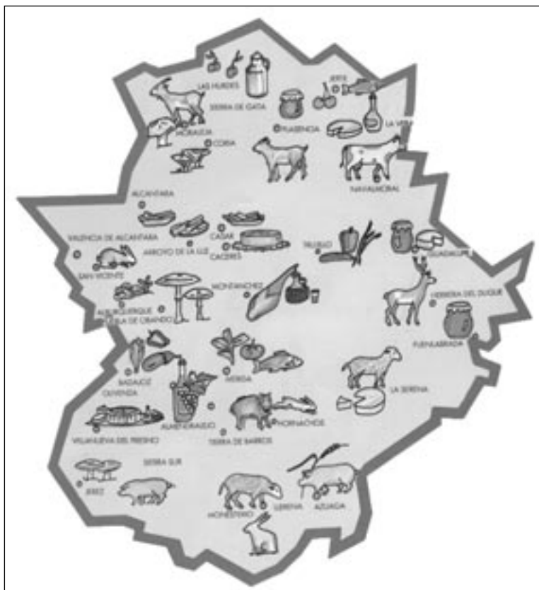
Mapa de gastronomía extremeña.

Se les facilitará un mapa de productos alimenticios de Extremadura y también una selección de textos como los siguientes: