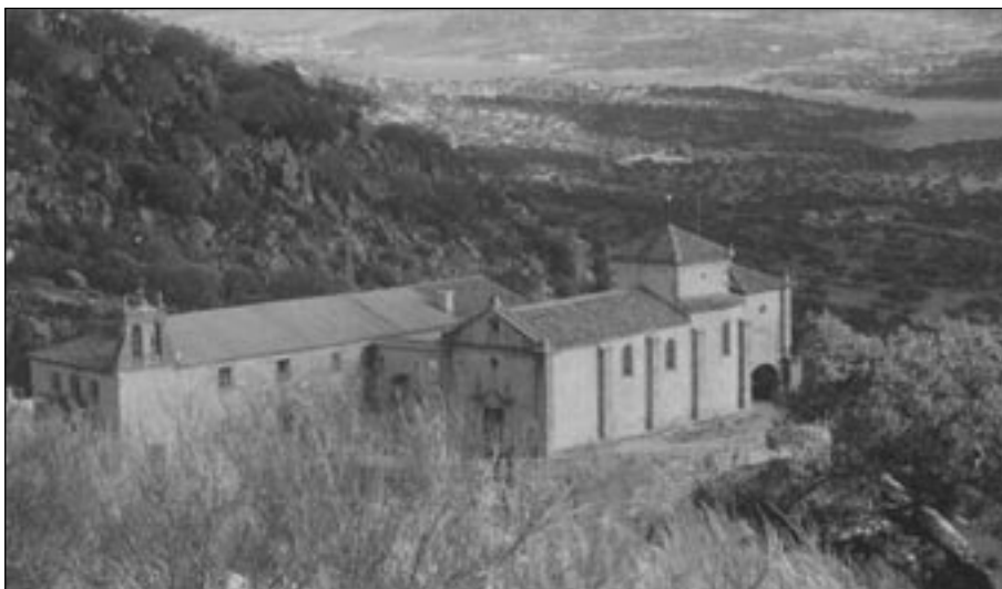
Santuario de Ntra. Sra. del Puerto en Plasencia (Cáceres).