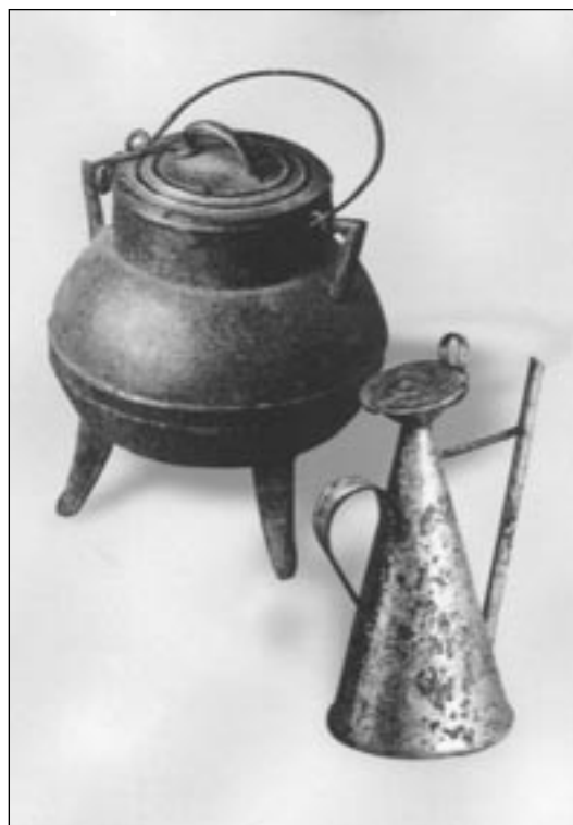
Pote y Alcuza.