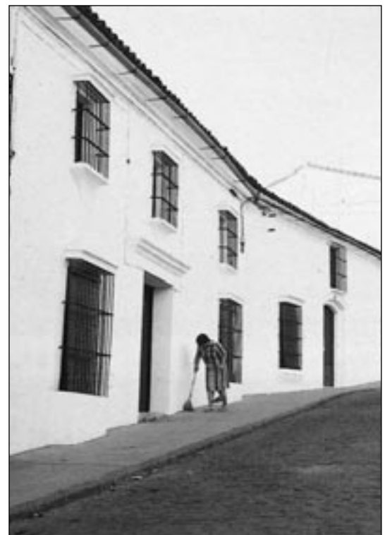
Casa de Fuentes de León (Badajoz).