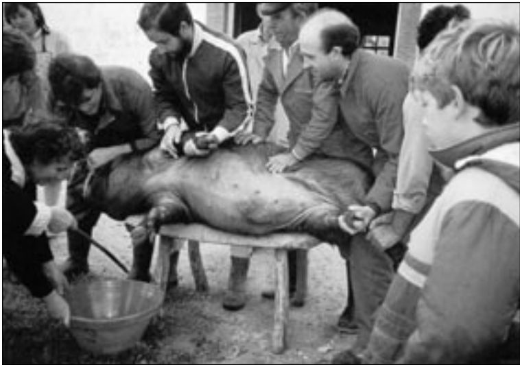
Sacrificio sobre banco de madera.