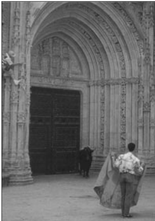
Los toros de San Juan en Coria (Cáceres), constituyen uno de los ejemplos más significativos de la unión del aspecto lúdico y el sagrado en la fiesta religiosa.

Es importante, además, indagar los orígenes de la fiesta de los toros en el núcleo, y determinar cómo se celebraba antes y cómo se celebra ahora, puesto que, quizás, los mayores recursos económicos han podido desviar la fiesta de su sentido tradicional y llevarla a lo que son en la actualidad las corridas de toros. El texto puede servir de punto de partida para este estudio.