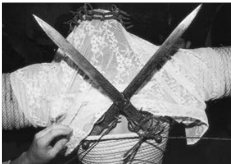
Semana Santa de Valverde de la Vera (Cáceres). Ritual de los Empalaos.