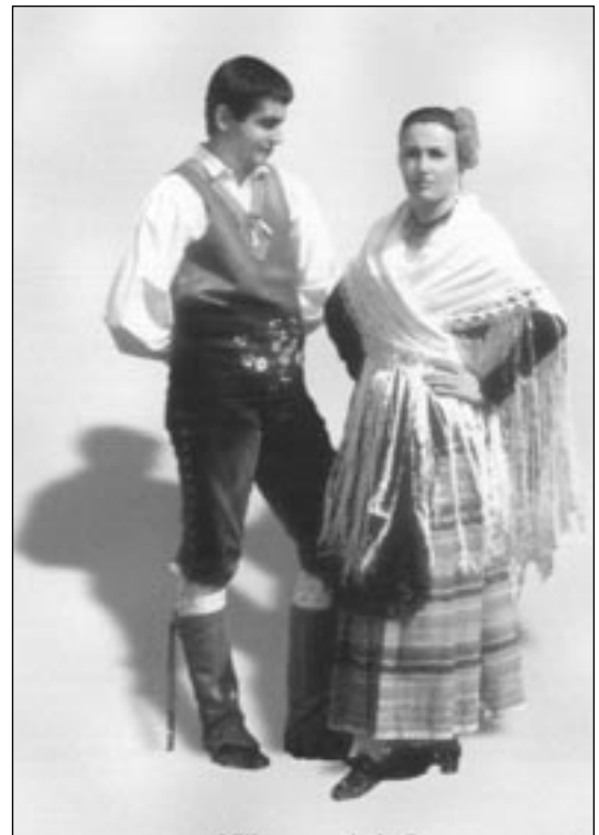
Traje típico de Villanueva de la Serena (Badajoz).