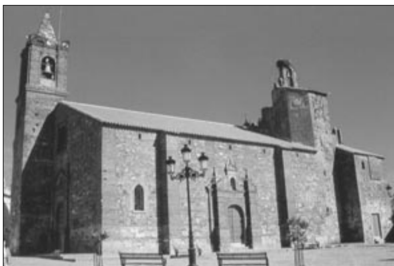
Iglesia Parroquial de San Pedro Apóstol del siglo XVI en Monesterio (Badajoz).

Nos parecería interesante iniciar su estudio con un análisis artístico del edificio, lo que podría proporcionarnos información sobre su fecha de construcción, y esto podría servirnos para situar cronológicamente a la fiesta. Con este fin se puede seguir el siguiente esquema: 30