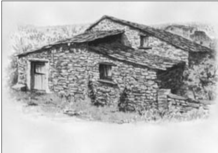
Casa de las Hurdes (Cáceres).

Se proyectarán las siguientes imágenes y se pedirá a los alumnos un breve comentario de lo que están viendo: materiales, formas, relación con el medio en el que están situadas, etc.