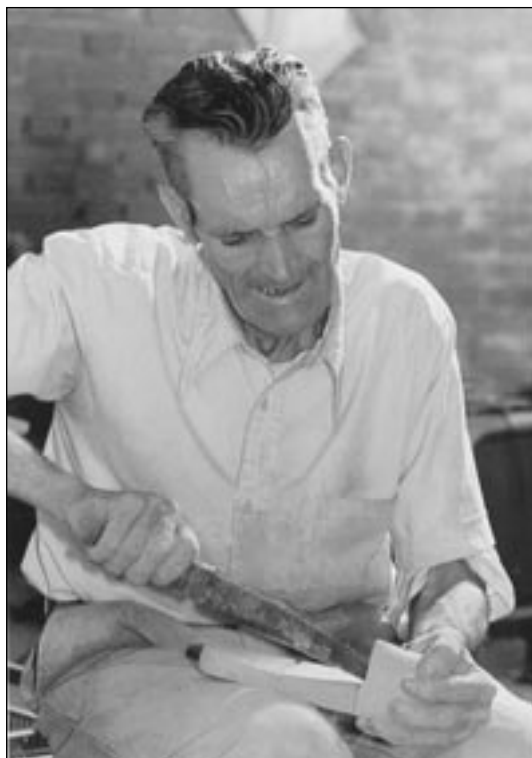
Artesano realizando una pipa.