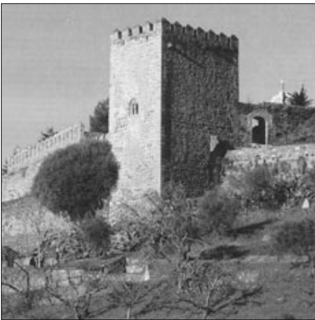
Torre del Homenaje del Castillo de Jerez de los Caballeros (Badajoz).

Las connotaciones taurinas resultan muy acusadas en la comarca, donde han sido tradicionales los festejos de toros desde tiempo immemorial, existiendo plazas de toros, algunas de gran presencia o antigüedad notable y marcado carácter popular, como son las de Jerez de los Caballeros o Fregenal". 21