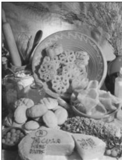
Dulces típicos de Extremadura.

No vamos a entrar en qué platos, y cómo se preparan, lo que sí habría que definir aquí es cuándo y cómo, porque probablemente respondiendo a estos interrogantes podamos constatar como la unión que implica una devoción religiosa permanece y se manifiesta en este aspecto de la fiesta. También sería interesante comprobar cómo dentro de la gastronomía es la repostería el campo más ligado al festejo religioso. Cada fiesta va a tener su dulce típico, como por ejemplo los huevecillos o repápalos de la Semana Santa o las roscas de la Candelaria, que son acompañados por el resto de los dulces tradicionales extremeños: flores, perrunillas, mantecados, etc.