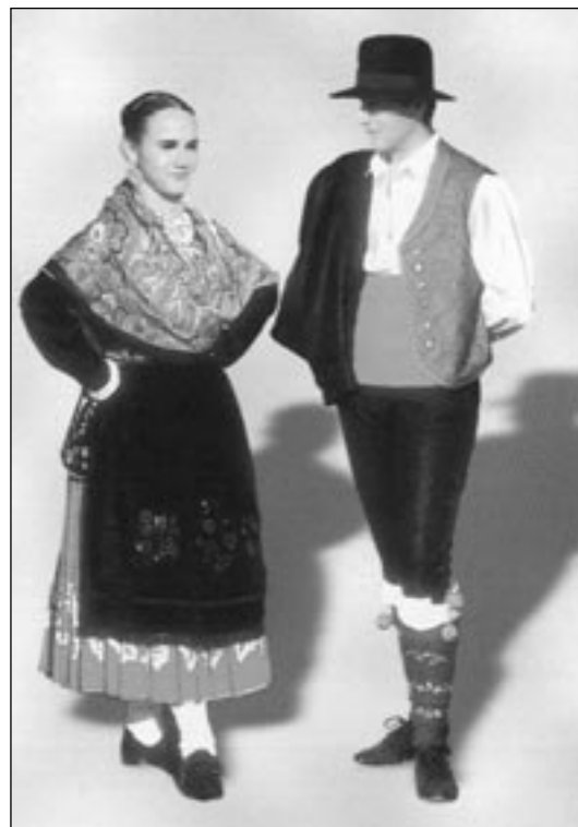
Vestidos típicos de la Sierra de Gata (Cáceres).