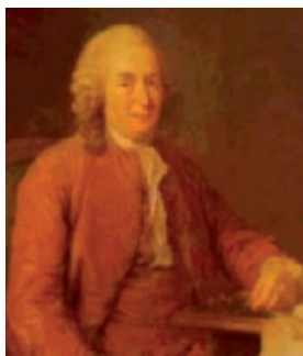
Carl von Linné (1707-1778)

Carl Von Linné ha pasado a la historia como el naturalista sueco que puso orden en la extraordinaria diversidad de seres que pueblan el planeta, creando una forma de nomenclatura (binomial) que todavía se utiliza, y estableciendo un sistema de categorías taxonómicas en las que hoy encuadramos a los seres vivos: especie, género, familia, orden, división o phylum y reino. Los grupos que resultaron de esta clasificación fueron