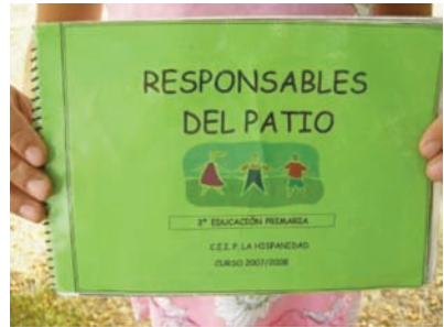
Libreta de anotaciones