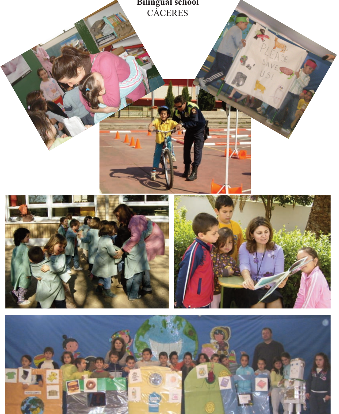
C.E.I.P. bilingüe “LA HISPANIDAD” Bilingual school CÁCERES