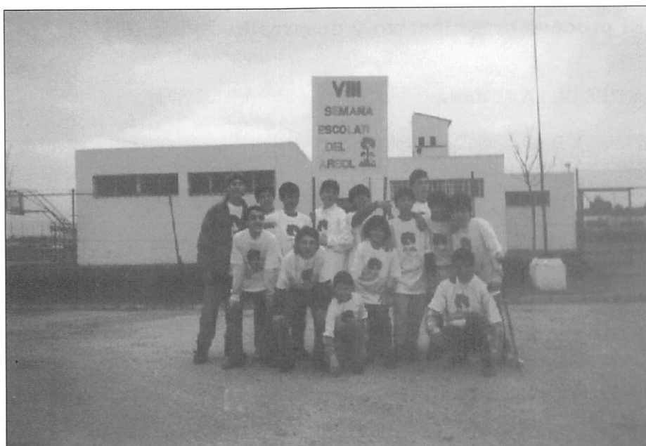
Grupo de alumnos del Centro organizador