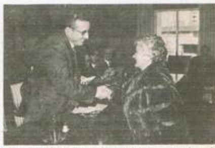
El gobernador civil, entregando uno de los premios a una profesora de Enseñanza General Básica.

Primeras autoridades y profesores se trasladaron a la prolongación de la calle Matías Montoro, donde se les a desear una larga vida en honra y memoria del que fue profesor de profesores y maestro de milares de discipulo.